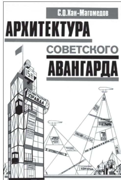
Селим Хан-Магомедов, Архитектура советского авангарда , Книга первая, Проблемы формообразования. Мастера и течения, Москва 1996. Обложка

Возникает естественный вопрос: если многие из этих экспериментальных проектов (в том числе и осу-