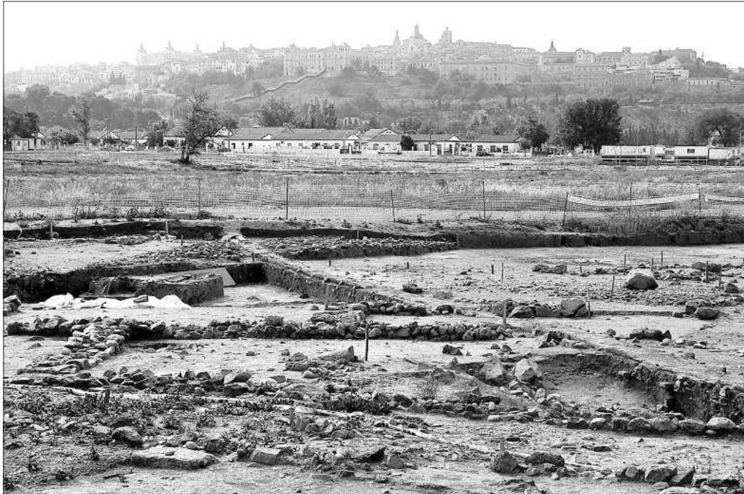
Vista del casco viejo de Toledo desde las excavaciones de la Vega Baja.