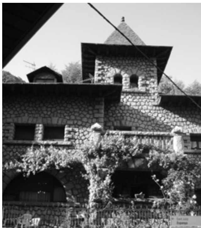
Xalet Casa Arajol