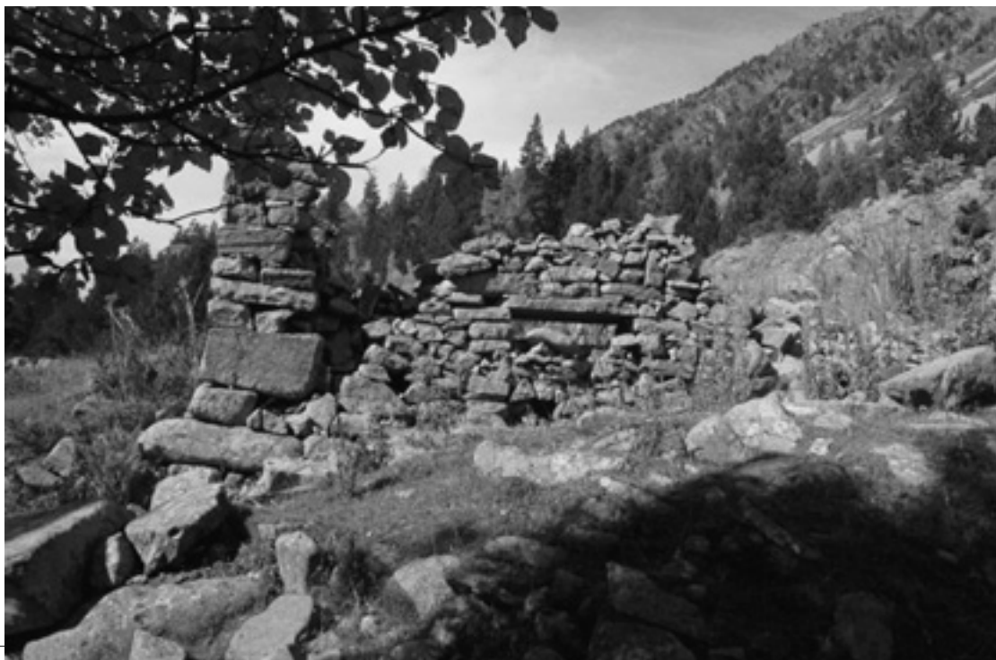
View of the Madriu Valley