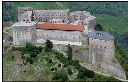
Figure 1. La Citadelle

Les monuments du Parc National Historique - la Citadelle, le palais Sans souci et le site fortifié des Ramiers - sont parmi les plus importants artéfacts haïtiens. Ils constituent non seulement les produits d'un extraordinaire travail social réalisé dans le passé mais aussi une sorte de négation du présent. La beauté de leur image est à la fois une présence spécifique du passé dans la réalité contemporaine et une critique de l'ordre social en Haïti près de deux cent ans après leur édification.