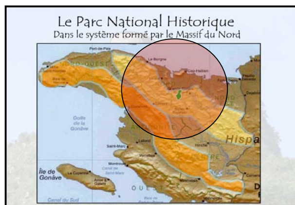
Figure 5. Le Parc National Historique : Citadelle - Sans Souci - Ramiers au centre de la région Nord d'Haïti