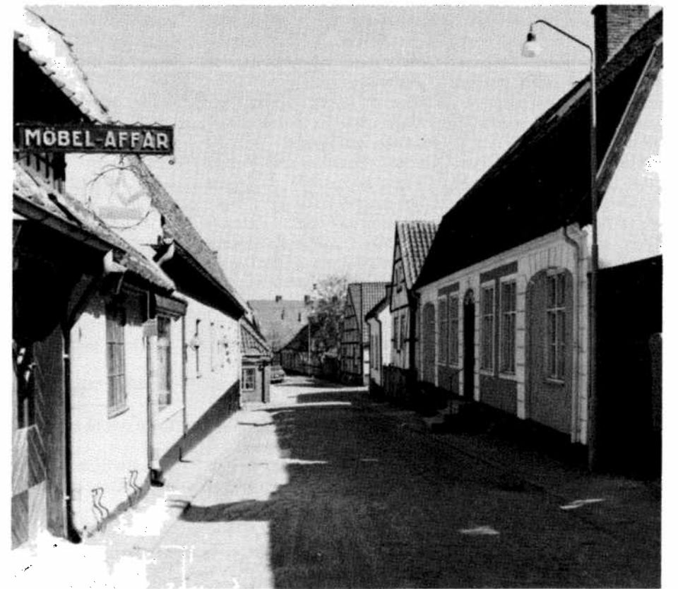
Streets in Simrishamn with one-storeyed buildings, most of them plastered, seldom in half-timber work. Rues à Simrishamn avec des maisons sans étage, la plupart des façades crépies, rarement des maisons en cloisonnage. Strasse in Simrishamn mit meistens geputzten einstöckigen Häusern; Fachwerkhäuser sind selten.