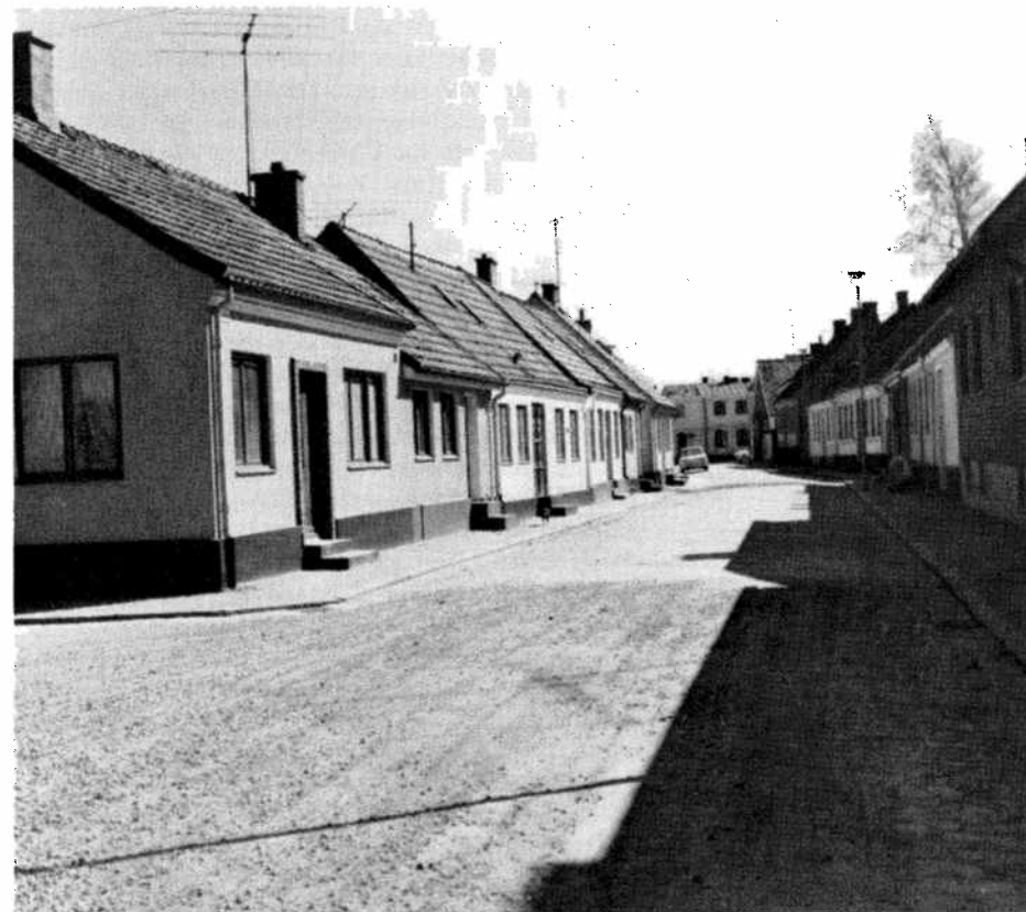
A representative street in Simrishamn. Une rue représentative de Simrishamn. Eine repräsentative Strasse in Simrishamn.

The harbour was entirely rebuilt during the last 70 years, but its immediate connection with the town was not cut off as was the case with most other towns in Skåne. The town surrounding the harbour, consisting of small stonewalled houses, has retained its original character. Increasing motorism has not been able to destroy the medieval street system. Consequently, no buildings have had to be demolished for that reason: the changes are due to "natural causes". Therefore, the old town core has been re-modelled at a rate allowing the environmental values to change harmoniously. This "quiet change" is what gives the old parts of Simrishamn their unique character. In this way, the existing preservation plan becomes an instrument not only for conservation but also for maintaining a rate of change by which it will be possible to keep our historical past alive.