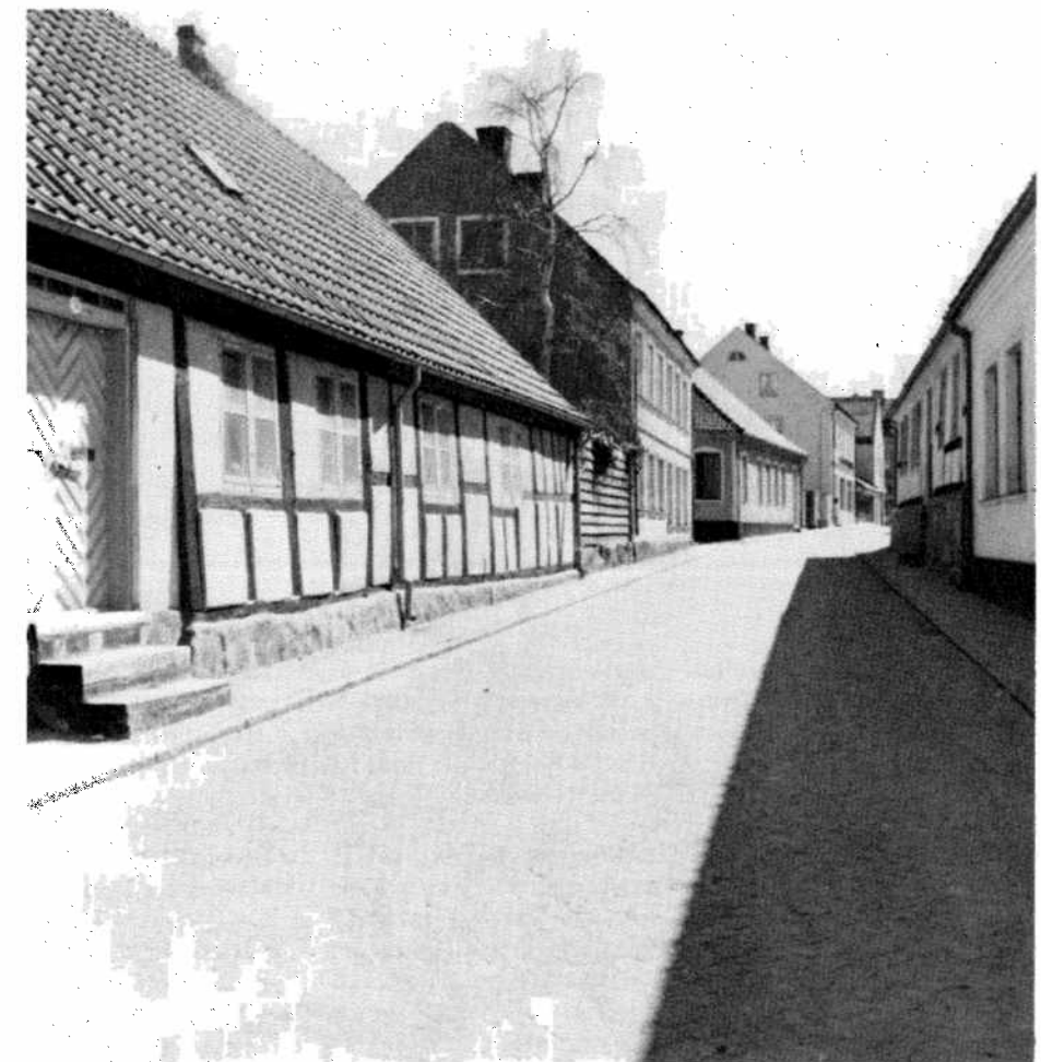
Street in Simrishamn. Rue à Simrishamn. Strasse in Simrishamn.