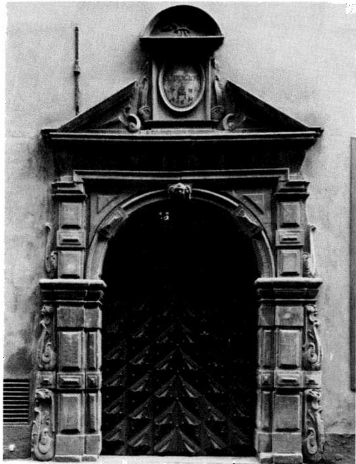
Ornamented doorway, Västerlånggatan 65 in the Old Town. Portail décoré de Västerlånggatan 65 dans la Vieille Ville. Ornamentiertes Portal in Västerlånggatan 65 in der Altstadt.