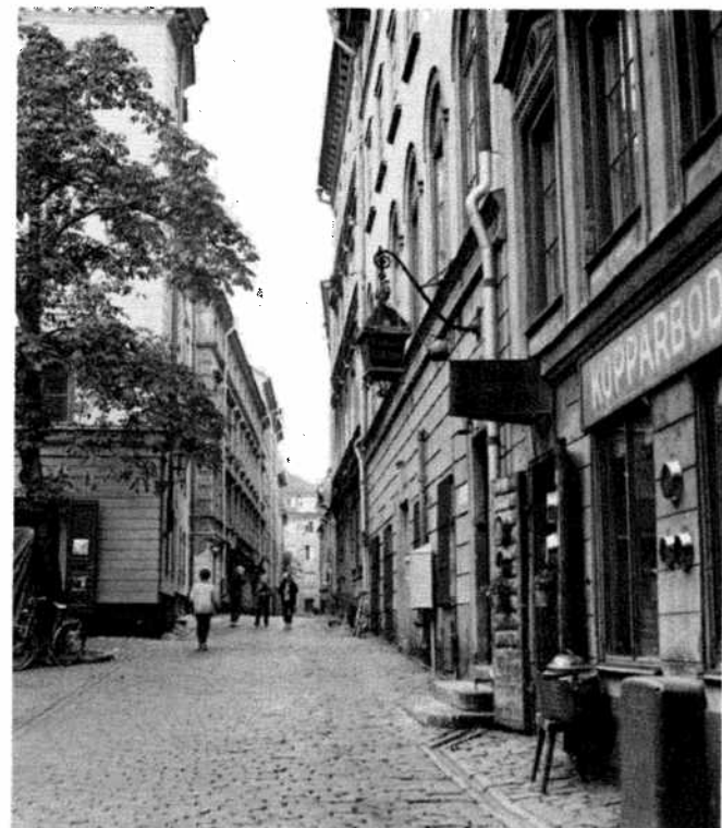
Street in the Old Town. Rue à la Vieille Ville. Strasse in der Altstadt.