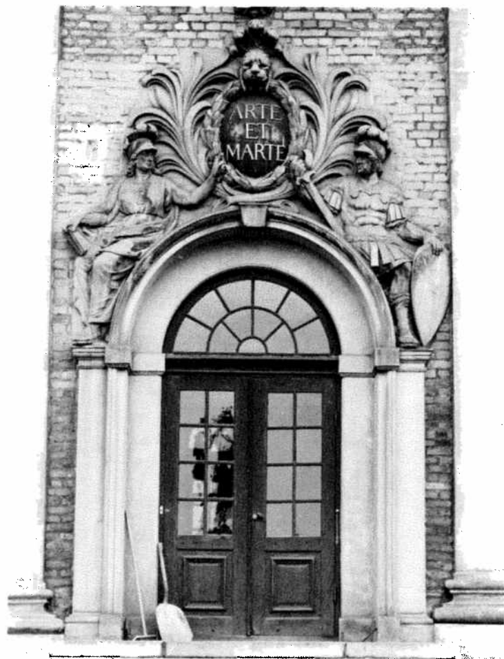
Doorway, House of the Nobility. Portail du Palais de la Noblesse. Portal am Haus der Ritterschaft.