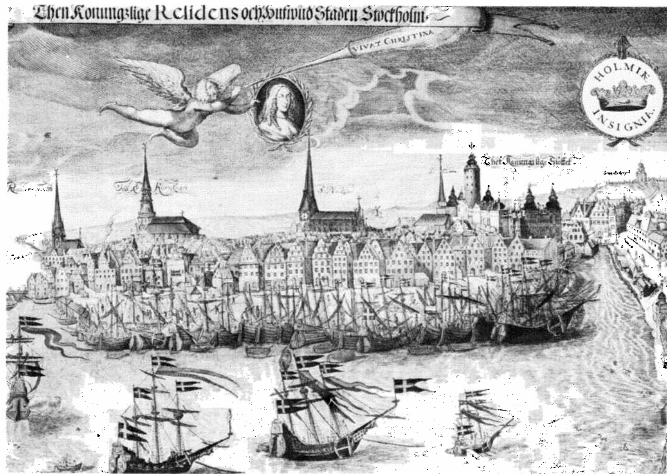
The Old Town from sea-side in the middle of the 17th century ... La Vieille Ville vue de la mer, environ midi du 17e siècle ... Die Altstadt von der See, Mitte 17. Jahrhundert ...