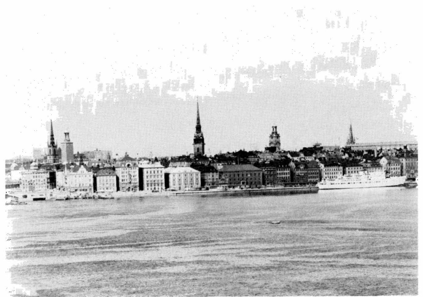
... and the Old Town to-day. ... et la Vieille ville aujourd'hui. ... und die Altstadt heute.

The narrow streets and alleys lend the Old Town a special