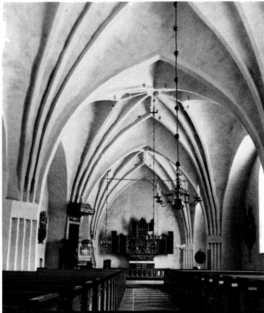
The interior of the church to the east after the renovation. L'intérieur de l'église à l'est après les travaux de rénovation. Das Innere der Kirche gegen Osten nach Renovierungsarbeiten.