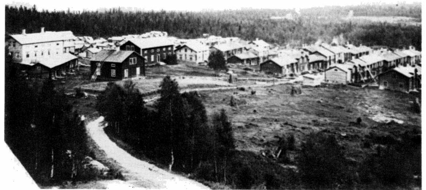
The picture shows the "Church Town" in the 1890s.

Renovation work, financed by grants from the National Labour Market Board, has proceeded since 1967, and replacement buildings have been erected. During term-time the church cottages provide hostels for young persons having to live in Vilhelmina on account of the great distances they would otherwise have to travel to and from school, and during the summer and winter holidays the same cottages are used as hotel accommodation.