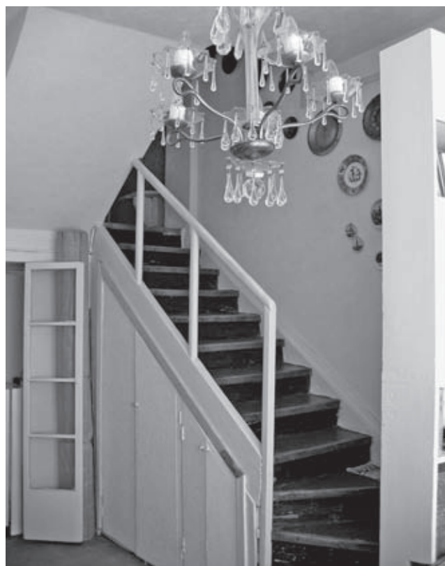
Дом-Коммуна на Гоголевском Бульваре в Москве, 1929, арх. М. Барц, В. Владимиров, И. Милинис, А. Пастернак, С. Славина. Квартира тип «Ф» 2005

Первым шагом на пути к «реинкарнации» домов коммун должны стать не архитектурные проекты и инвестиционные предложения, но исследовательская и пропагандистская работа. Выявление покинутых зданий домов-коммун – памятников архитектуры 1920–30-х годов в крупных и средних городах России позволит создать своеобразную «карту» будущей сети из 15–20 дизайн-отелей. Изучение мирового опыта реставрации и перепрофилирования памятников архитектуры XX века, в том числе для создания недорогих отелей, и анализ отношения российских и иностранных потребителей к советской революционной стилистике лягут в основу «модельной» схемы гостиницы «Дом-Коммуна». Презентация этой модели на разных уровнях – от архитектурно-реставрационного сообщества до потенциальных инвесторов и местных администраций – даст возможность шаг за шагом менять отношение к этим зданиям, достойным светлого будущего.