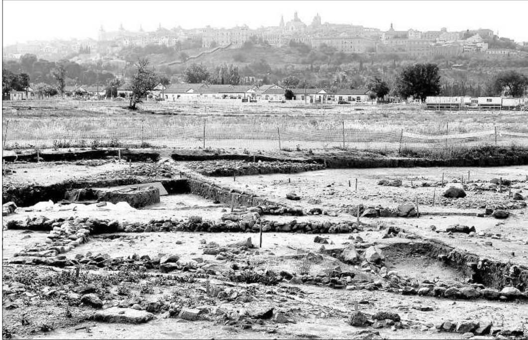
Actuales excavaciones en los terrenos de la Vega Baja con el casco histórico de la ciudad de Toledo al fondo.

"Los visigodos se asentaron apropiándose de las ciudades romanas e incorporando desde el poder sus costumbres culturales y habitacionales. Y vivieron allí dos siglos, hasta la llegada de los árabes. Lo que se ha encontrado es, ni más ni menos, que la capital del reino visigodo, que se extendía desde el norte de África hasta el sureste de la Galia (Francia). Una ciudad donde se firmaron numerosos conci-