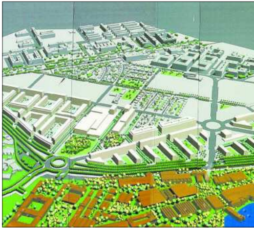
Proyección gráfica del cartel que anuncia las obras previstas en la Vega Baja.