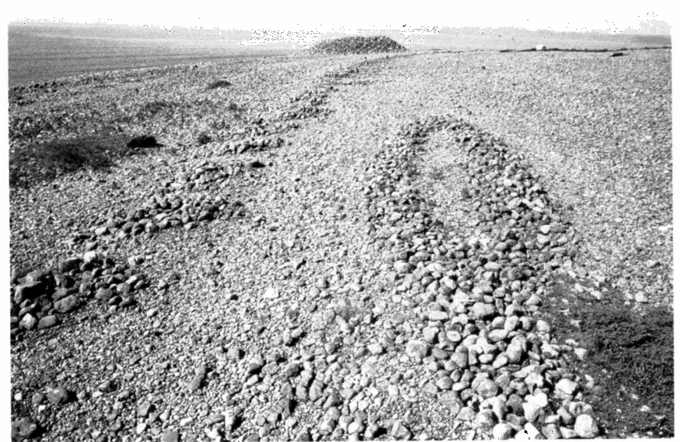
In the foreground, the boat-shaped cairn (D 100) in which the iron rivets were found; on the left, one of the rows of small cairns (row F) with the large «ship cairn» (D 112) behind.

Les avis sont partagés sur l'interprétation de ces symboles. Le bateau incinéré et l'alignement en