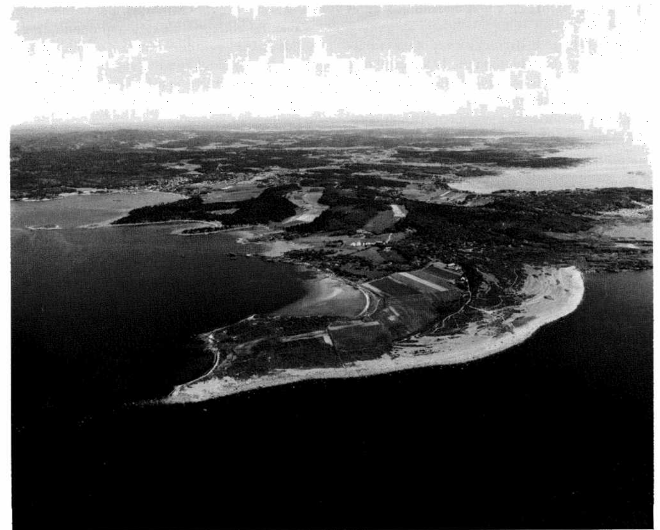
Mølen, Vestfold, looking north from the sea. The moraine ridge continues as a natural mole or breakwater at the mouth of Langesundsfjord.

Généralement, on considère que ces tumuli