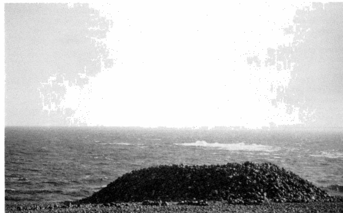
Skipsrøysa, «the ship cairn», (D 112), is the largest cairn in the Mølen cemetery.

On a recensé en tout 208 tumuli, dont seize étaient de taille relativement importante. Néanmoins seulement quatre d'entre eux peuvent être considérés comme de grands tumuli, avec un diamètre entre 25m. et 35m. (D27, 112, 197 et 212). Le tumulus situé le plus à l'ouest, D27, est au niveau le plus bas, 6,8m. au dessus du niveau de la mer. Deux tumuli longs, D129 et 206, ont respectivement 40m. et 35m. Au milieu de ces tumuli se trouve un alignement de pierres, de forme ovale, ressemblant assez à un bateau (D100). Cet alignement, d'environ 20m. de long, a été fouillé en 1972–73. Il y a d'autre part un certain nombre de