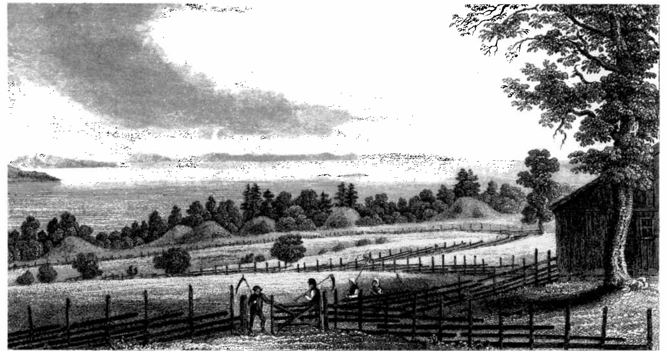
The great tumuli at Borre, Vestfold, the traditional burial place of the Viking Ynglinge dynasty. Drawing by Johannes Flintoe, 1838.

Mølen est protégé par loi selon des clauses spéciales. Le Musée des Antiquités de l’Université d’Oslo a fait l’acquisition du site, il en a également la responsabilité et assure son entretien. On ne