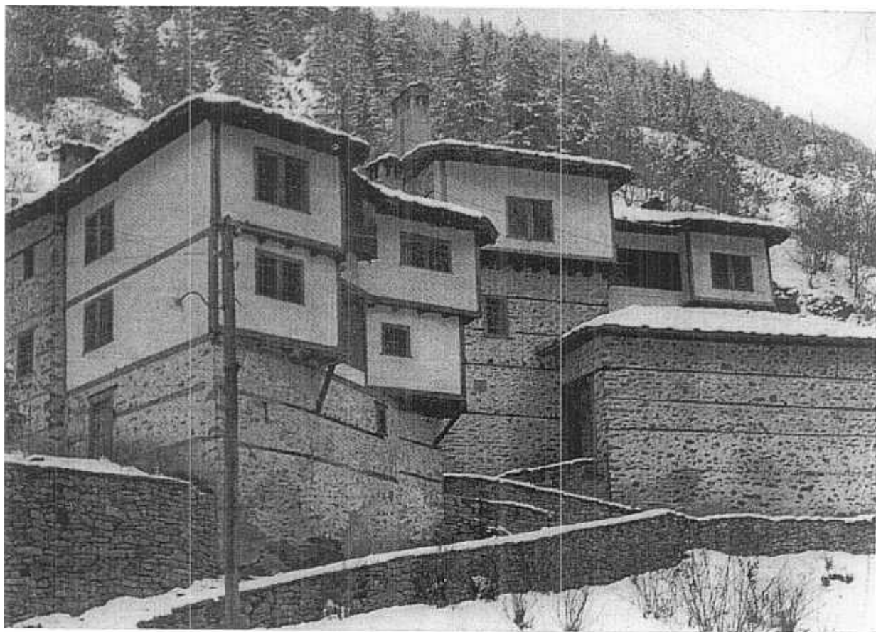
8. Chiroka Laka. Le konak des Sgourov, adapté en école de musique instrumentale folklorique.