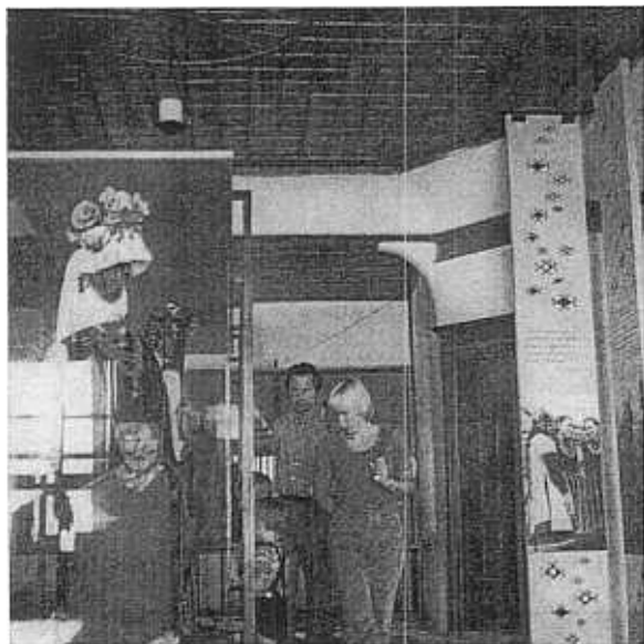
3. Nessebar. La maison des Mouskoïani — adaptée en musée. Vue intérieure.