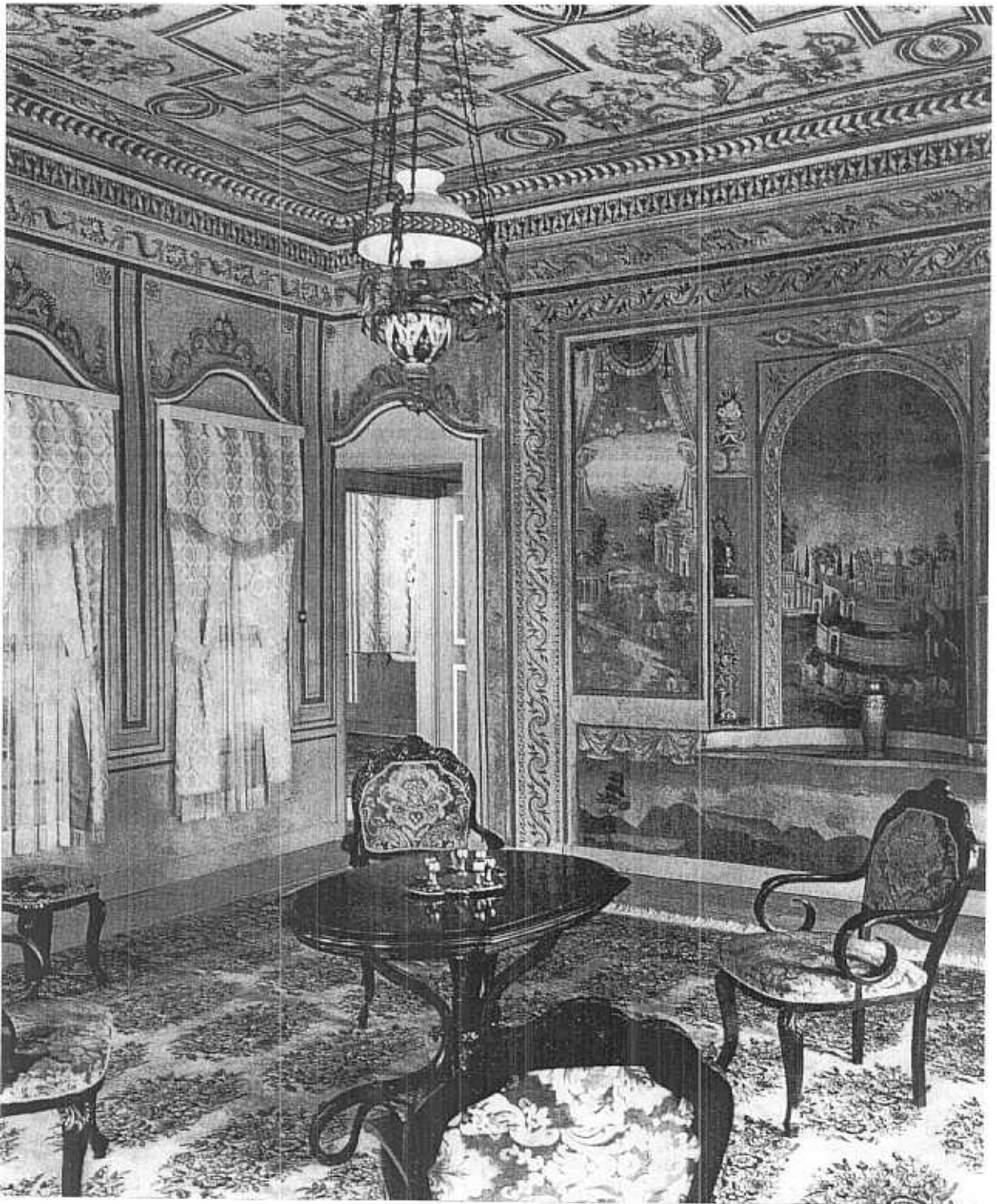
7. Plovdiv. Maison d'accueil sise au 4, rue A. Guidikov. Vue intérieure.