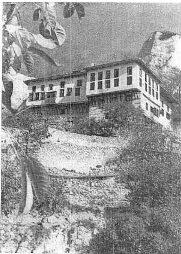
9. Melnik. La maison des Kourdopoulo.

Mais il serait peut-être utile d'aborder le problème des aménagements intérieurs et de l'ameublement que l'on peut y introduire. Les maisons que nous avons étudiées plus haut sont meublées dans l'esprit des siècles passés. Cette solution semble la plus valable car les éléments de décor immeubles par destination — murs, plafonds, planchers, portes et fenêtres — exigent un ameublement qui leur corresponde. Le lien entre décoration et mobilier est encore plus impératif dans les nombreuses maisons où les parois sont ornées de peintures murales et où plafonds et portes sont de bois sculpté, comme à Plovdiv, Koprivchtitza, Triavna, Arbanassi. . . Un nombre croissant d'architectes et de décorateurs s'attachent à retrouver l'esprit des siècles passés dans ces aménagements intérieurs. En parti-