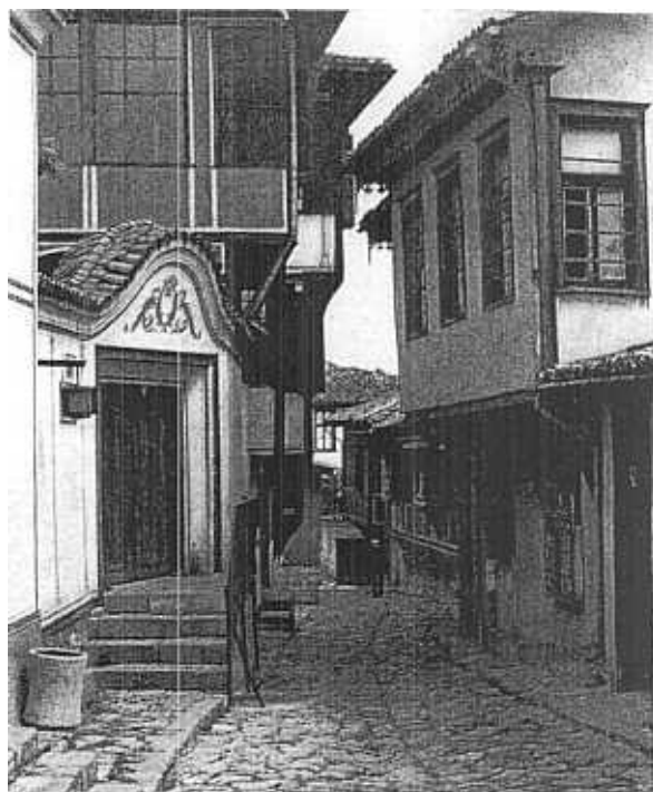
6. Plovdiv. Rue. A gauche — le restaurant „Alafranguité“.

fonctionnaires, des hommes politiques, des membres de l'Union des Architectes, des Artistes, des Peintres etc. . . s'y donnent rendez-vous pour accueillir leurs hôtes bulgares ou étrangers. On choisit, pour ce rôle, des demeures d'une certaine importance, surtout des maisons à plan symétrique datant de la seconde moitié du XIX ème siècle, du type „maison de Plovdiv“. Ces maisons se retrouvent dans d'autres villes du pays, mais les exemples d'adaptation à des fonctions nouvelles réalisées à Plovdiv pourraient servir d'exemple ailleurs.