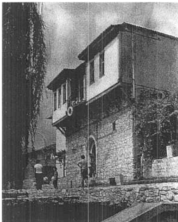
Nessebar. Le restaurant „Kapitanska srehta“.