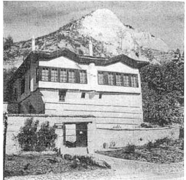
2. Melnik. La maison des Pachov — adaptée en musée

— Groupe E: maisons anciennes à des fins touristiques.