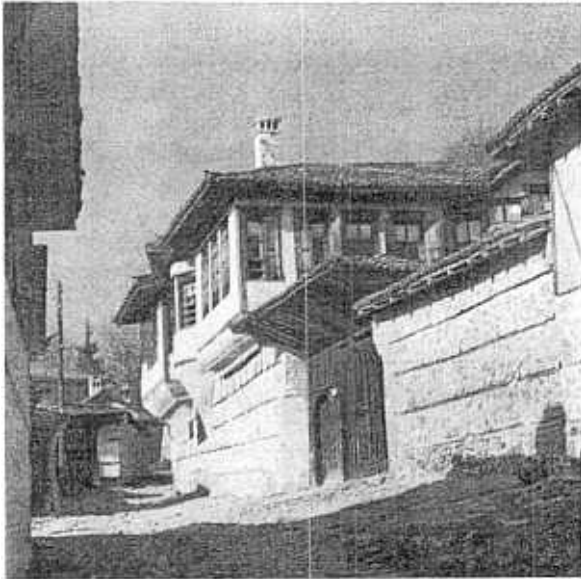
1. Koprivchitza. La maison-musée „T. Kablechkov“.