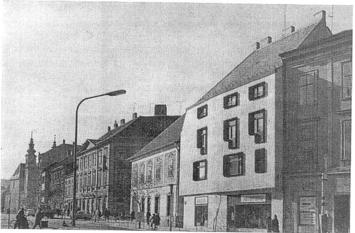
2. Sopron. 110, Bd Lénine.

Aussi, comprend-on l'intérêt suscité dans les milieux professionnels par un concours pour l'intégration de sept bâtiments neufs dans le village ancien d'Hollökö. Hollökö est un village de 700 habitants, situé au pied d'un château-fort du XIII ème siècle, resté imposant dans ses ruines. L'histoir