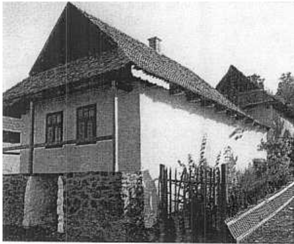
3. Hollókő. Maison typique.