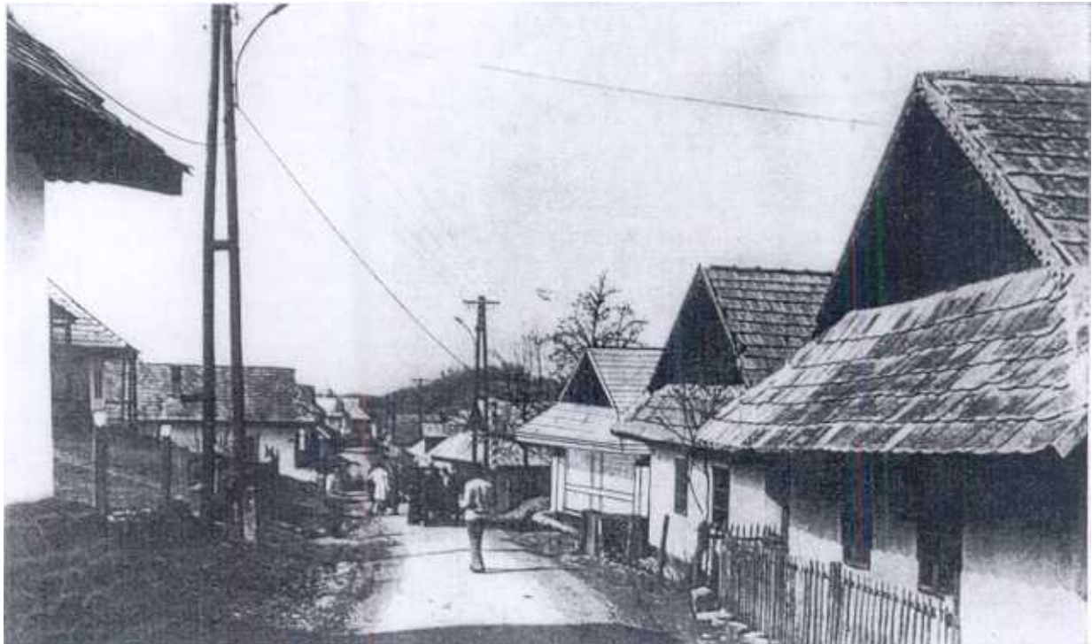
P: ine ma

Les travaux présentés, estime le jury, auraient été meilleurs si les concurrents s'étaient plus libérés des idées qu'ils avaient exprimées dans la première partie du concours et s'ils avaient proposé des solutions plus variées pour chacun des bâtiments, selon la situation et la configuration du terrain ainsi que leur fonction future. Les architectes des projets qui viennent de vous être présentés ont d'ailleurs commis la même erreur.