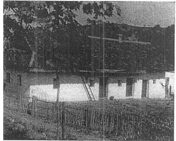
4. Hollókő. Projet d'une maison

du village s'est tout naturellement confondue avec celle du château-fort qui le domine. Hollókő faillit se dépeupler complètement au cours des guerres contre les turcs, aux XVIème et XVIIème siècles. Cette commune, dont l'origine et la structure remontent au moyen-âge, doit son caractère particulier à ses belles maisons populaires.