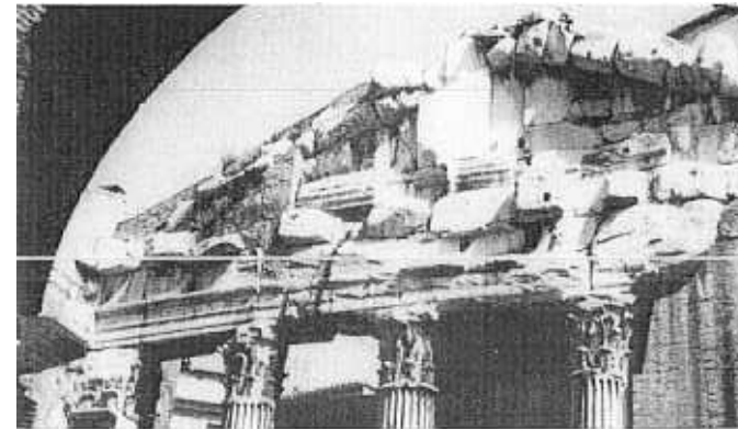
The historic centre of Rome; a detail of the Portico d'Ottavia.

Mais il ne s'agit là que d'un début et toute la communauté internationale est invitée à utiliser ce cadre unique pour coordonner ses efforts pour sauver le Patrimoine Mondial pour les générations futures.