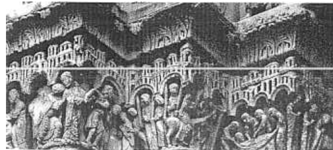
A detail of the west door, Chartres Cathedral, France.

But this is only a start, and the international community as a whole is invited to use this unique framework to channel their efforts in helping save the world heritage for future generations.