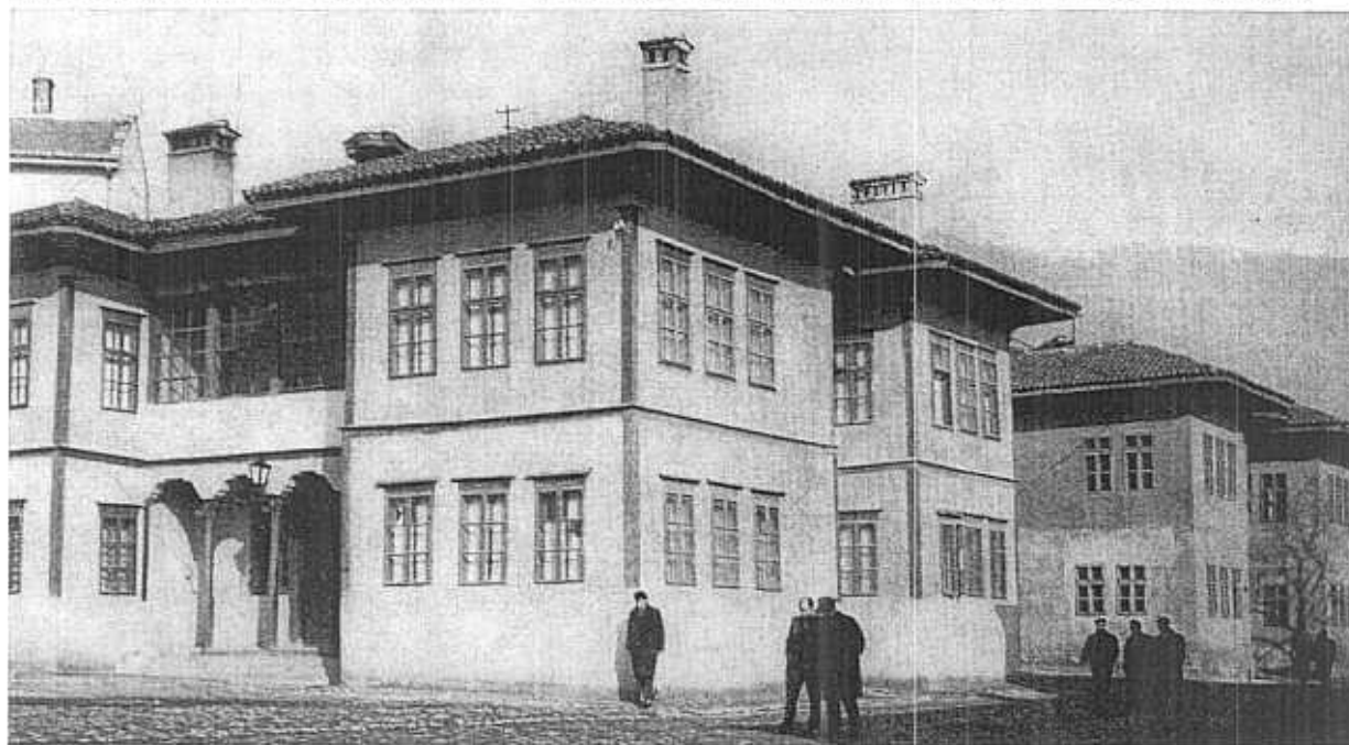
1. Vranje. Les konaks du Pacha, deux bâtiments — le salamlık et le haremlik, aujourd'hui sièges du musée et des archives.

Les maisons de cette époque ont, en général, une cave,