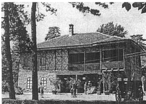
3. Kraljevo. Konak de Gospodar Vasa. Façade principale.