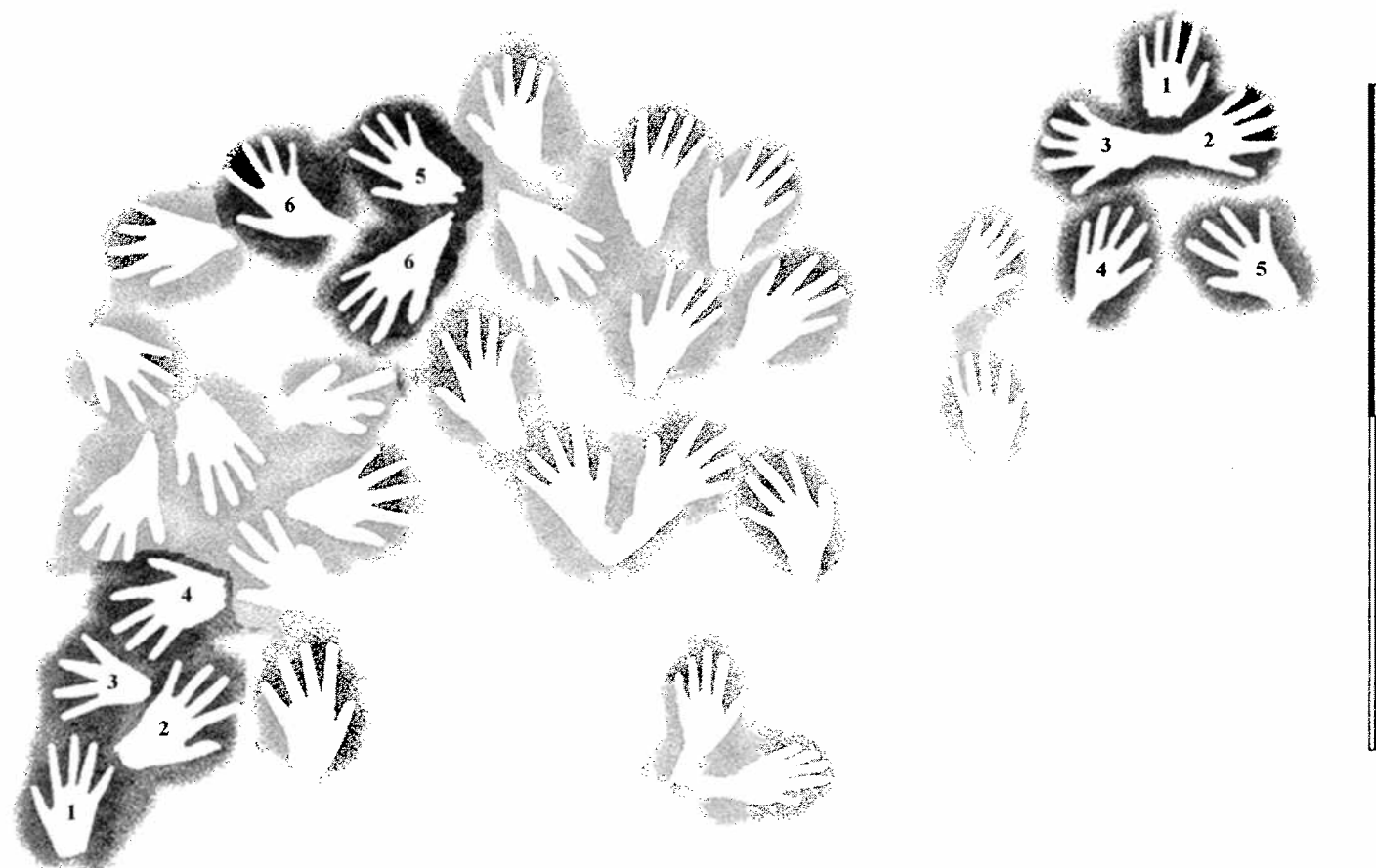
Fig. 3. Détermination et regroupement des mains semblables (les chiffres correspondent aux mains ayant un même indice entre tous leurs doigts).

They show that six different hands were identified as being multiple or reproduced. This is a complementary