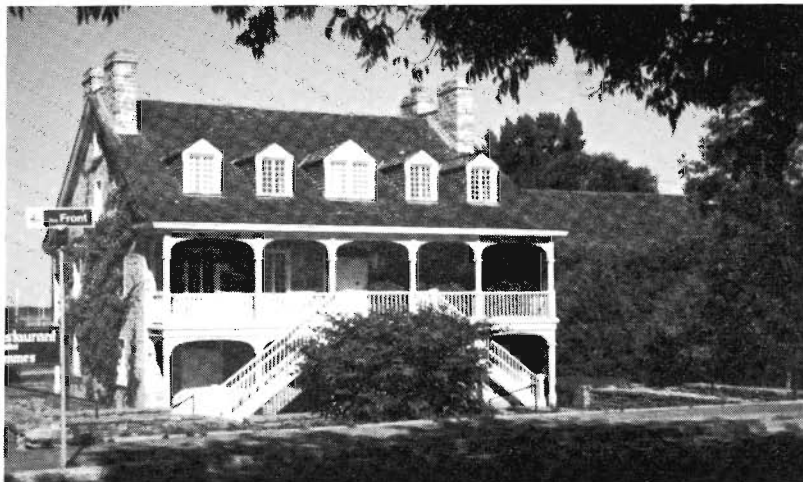
L'auberge Symmes à Aylmer