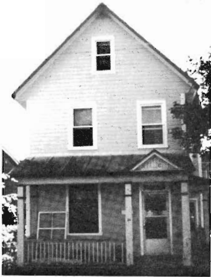
Maison hulloise, 20 A, rue Lois, Hull