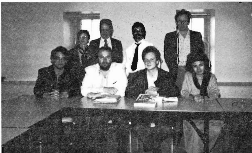
Le comité au travail/ committee at work 11 mai 1991

Réalisée par de véritables artisans et dont les savoir-faire sont recon-