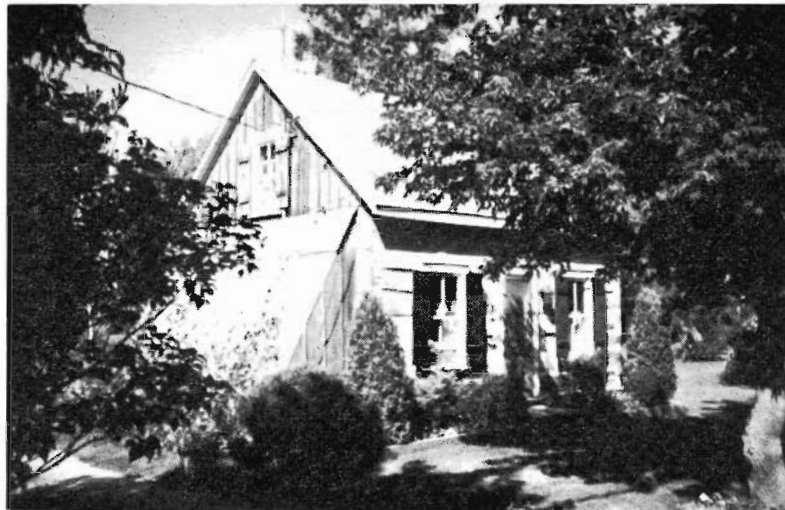
Maison en pièce-sur-pièce du Pontiac, Luskville

tie du XIX e siècle avec des matériaux locaux, par les gens du lieu et selon des techniques éprouvées, la maison en pièce-sur-pièce du Pontiac (fig. 3) représente le meilleur exemple d'architecture vernaculaire, si l'on confère à ce terme son sens le plus restreint.