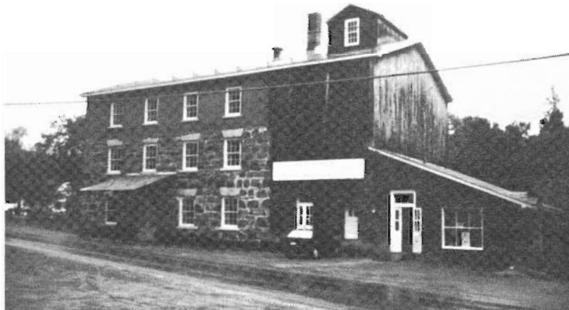
Le moulin Maclaren, Wakefield

maçonnerie étant entièrement détachée de la charpente en bois, l'extérieur a su résister au feu; l'intérieur fut cependant complètement refait. Cet immeuble de quatre étages, en pierre et en brique, avec un toit à deux versants, fut agrandi et rénové en fonction de l'expansion de l'activité meunière dans cette région. Vu sous cet