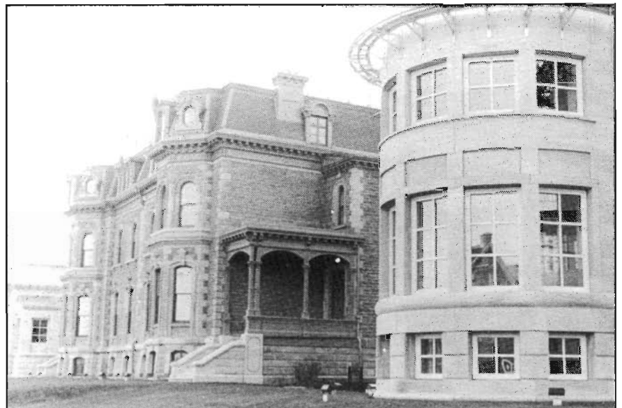
Le Centre Canadien de l'Architecture de Montréal où s'est tenue l'assemblée générale du Groupe Francophone samedi le 4 novembre dernier.