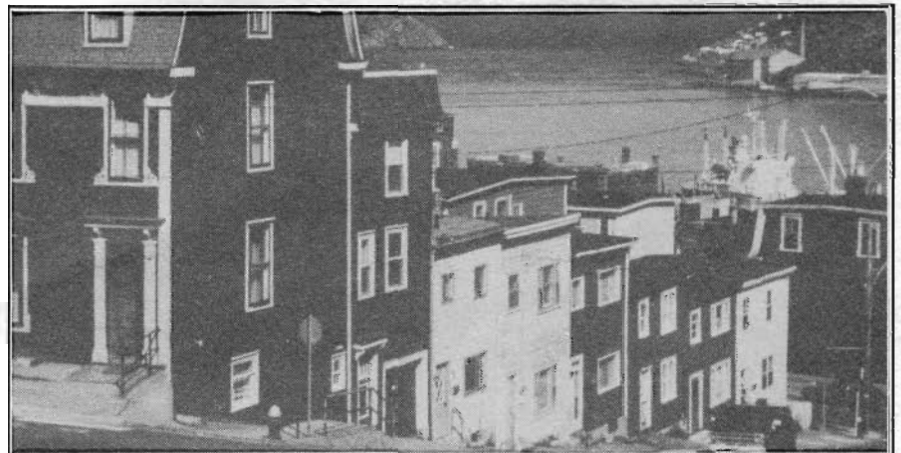
Vue pittoresque d'une rue de Saint-Jean, Terre-Neuve, donnant sur le port et l'océan Atlantique. C'est dans cette ville que s'est réuni le Conseil d'administration au mois de juin dernier.