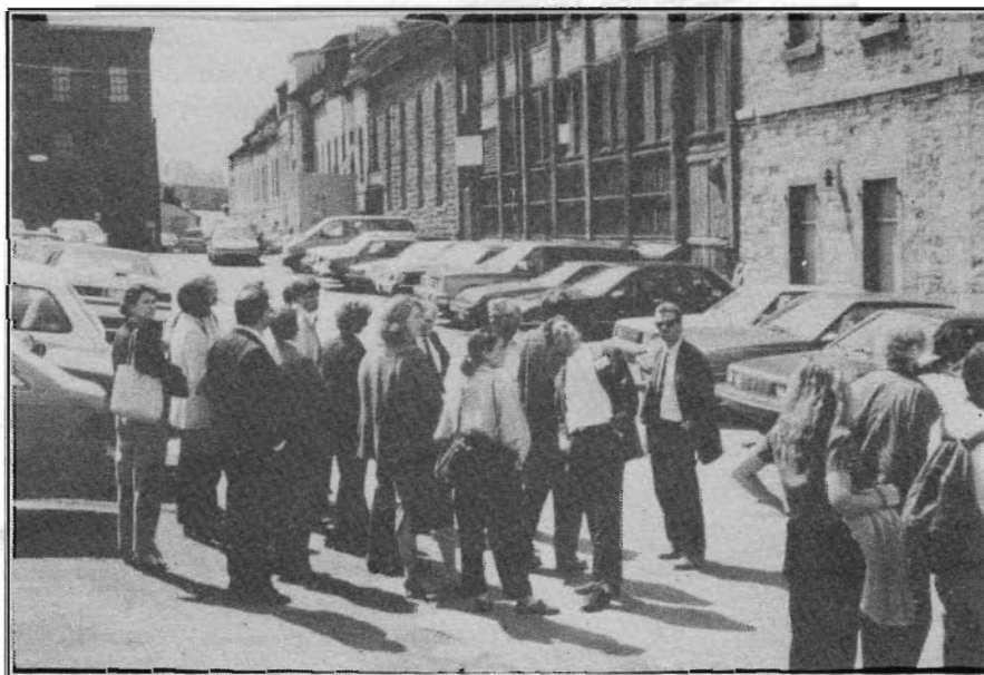
Visite du site des Nouvelles Casernes, Parc de l'Artillerie, site ayant fait l'objet d'une étude de cas à l'occasion du colloque sur les relevés et les villes historiques au mois de mai dernier à Québec.