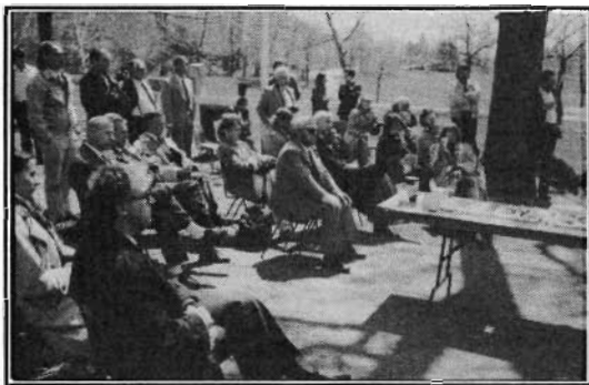
Les participants au colloque sur la formation (mai 1989). Treize pays y étaient représentés.

En effet, la conservation du patrimoine, après avoir longtemps été perçue comme une activité autonome, figure maintenant parmi les sujets qu'il est normal d'aborder lors-