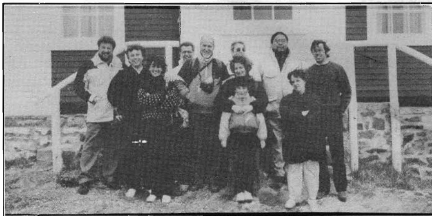
Le Conseil d'administration national réuni devant le phare historique de Bonavista, à Terre-Neuve, en juin dernier.

L'APT, l'association pour la préservation et ses techniques, organise son prochain colloque annuel à Montréal en 1990 en collaboration avec Héritage Montréal. Nous convenons d'offrir, à la mesure de nos champs de préoccupation, nos services pour aider au succès de cette assemblée.