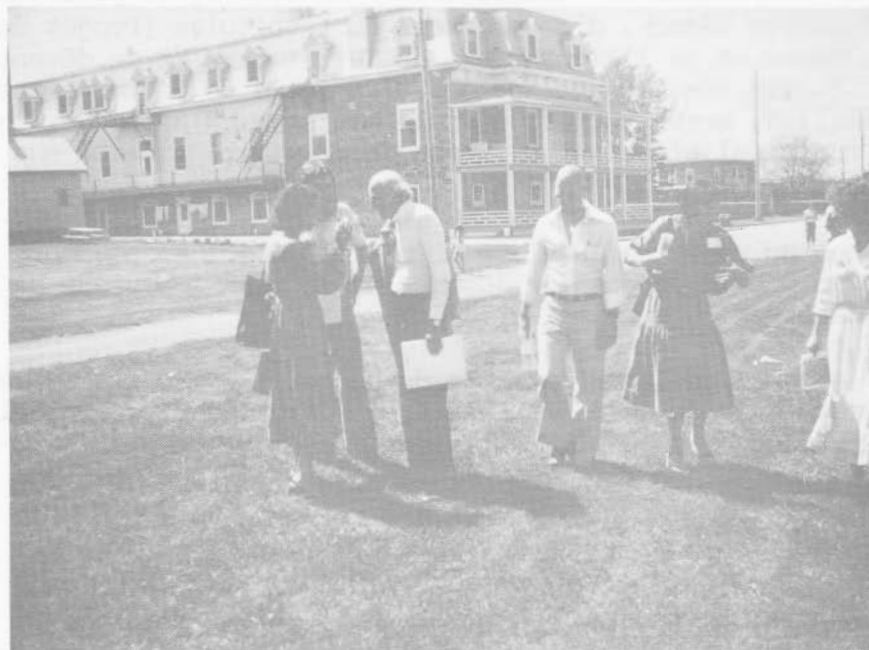
Couvent de Deschambault.