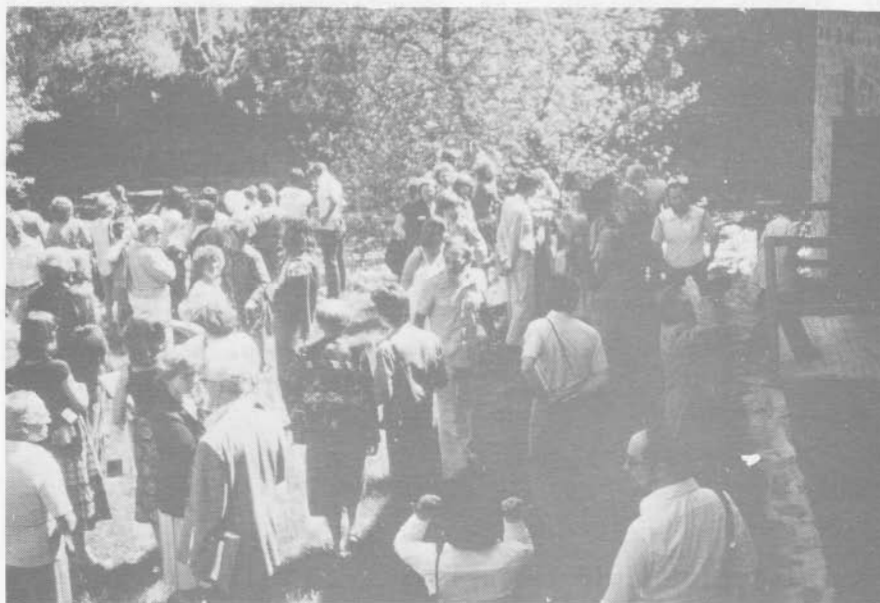
Moulin Marcoux. Pont-Rouge.