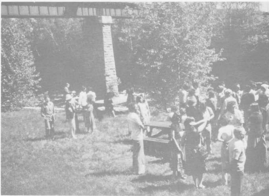
Le Moulin Marcoux Pont-Rouge.