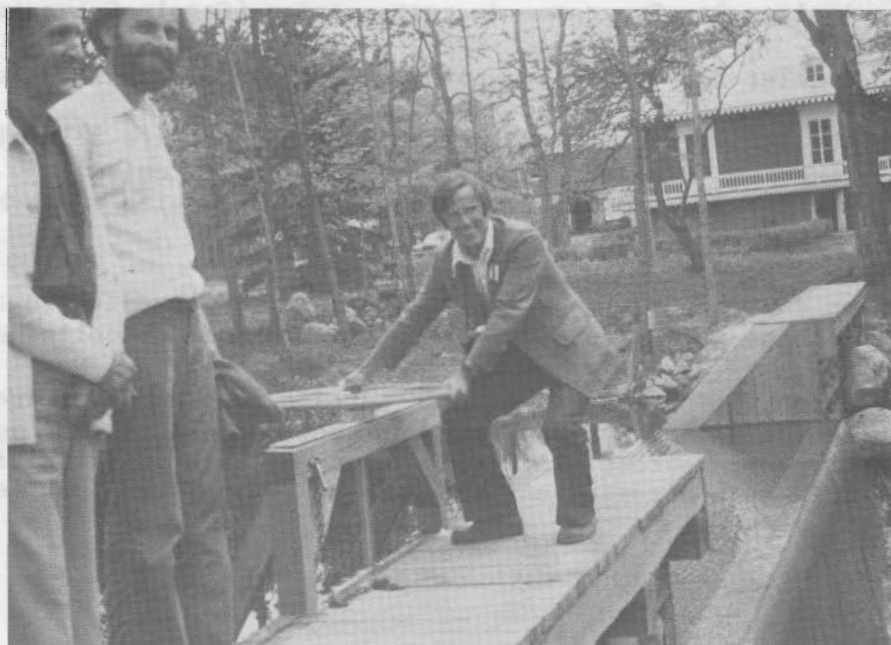
"Moulin Banal" St-Roch-des- Aulnaies.