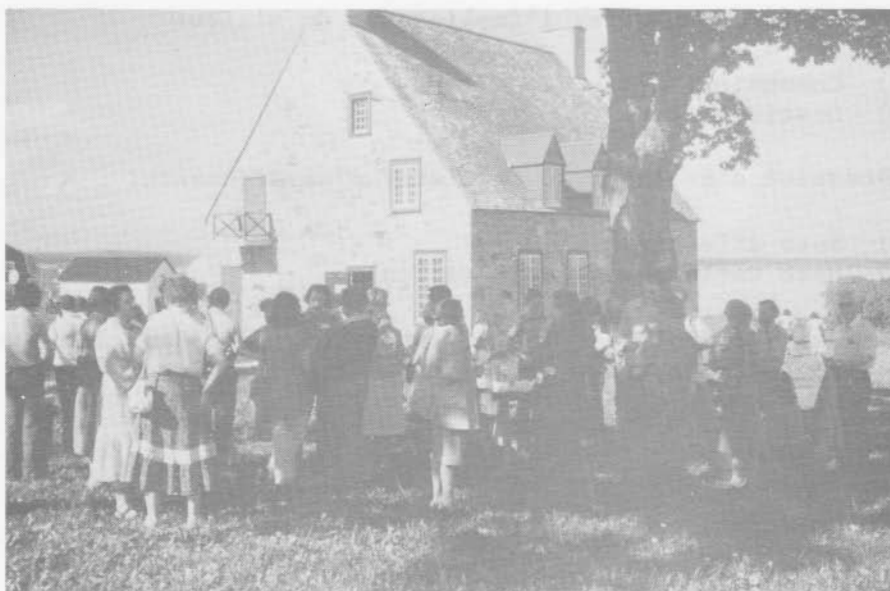
Vieux Présbytère. Deschambault.