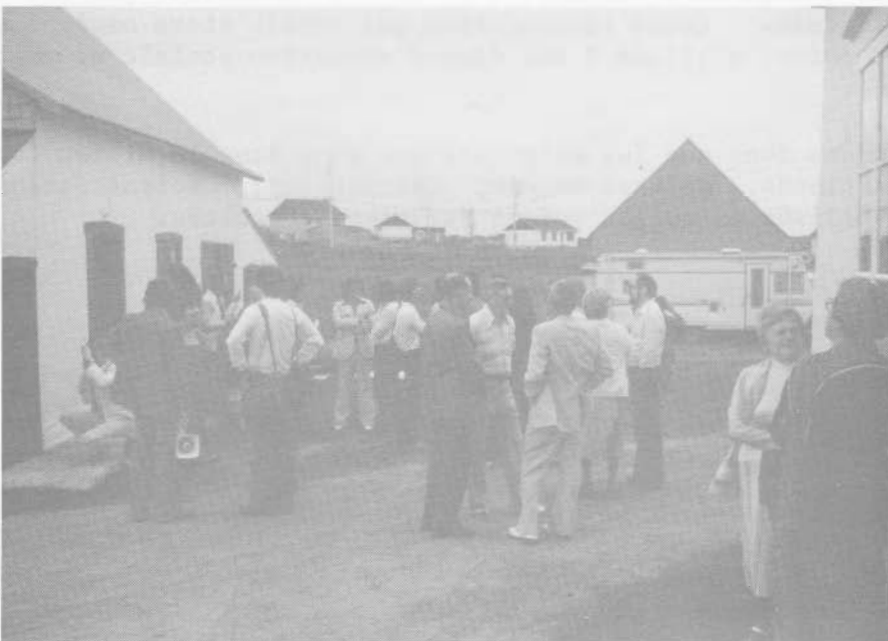
Domaine Seigneurial Beaumont.