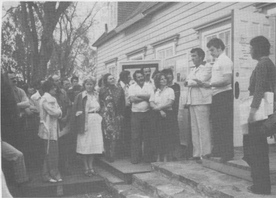
Manoir Couillard- Dupuis, Montmagny.