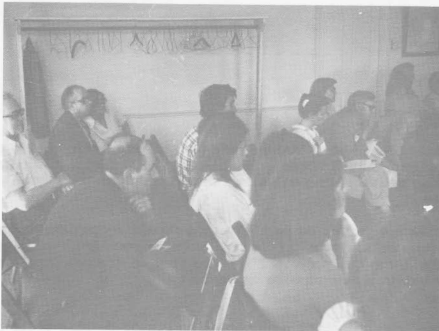
Vieux Presbytère Deschambault.

Identification des éléments socio-économiques et culturels. Le concept de patrimoine d'ensemble: sa fonction sociale, économique et humaine. La ré-insertion des éléments patrimoniaux dans la vie économiques de la région etc... Appropriation du patrimoine et implication de la population dans la formation technique.