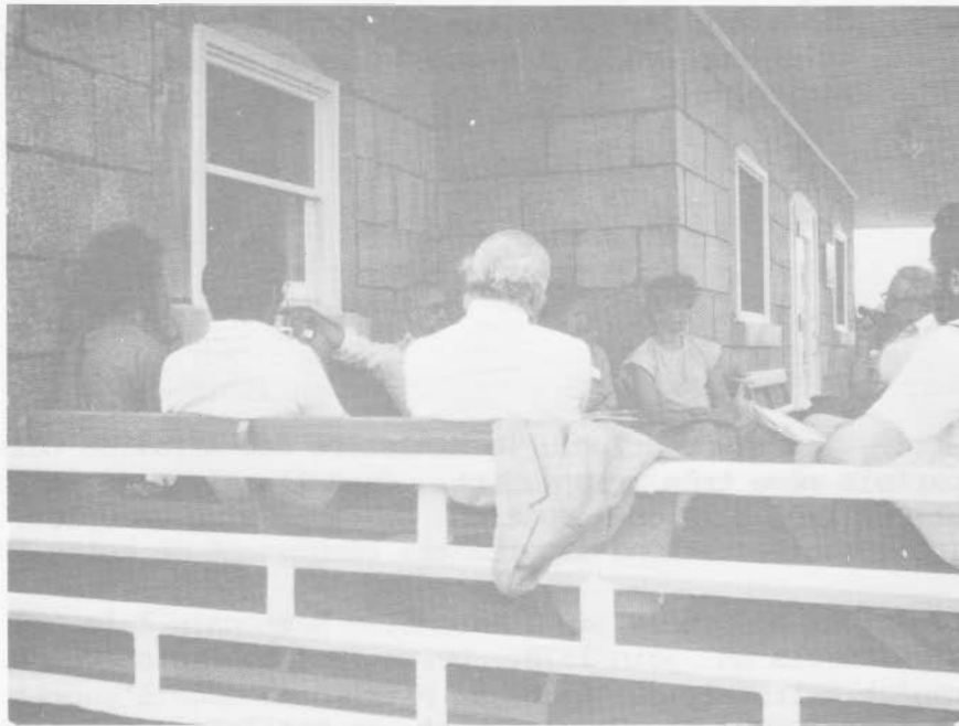
Au Couvent de Deschambault.

Implication de la loi sur le zonage agricole et de la loi sur l'urbanisme sur les ensembles patrimoniaux identifiés, non-classés, décrétés. Participation des groupes dans les divers paliers décisionnels. Les programmes d'aide des Directions de l'Animation, Archéologie, Inventaire, Monuments historiques, Arrondissements.