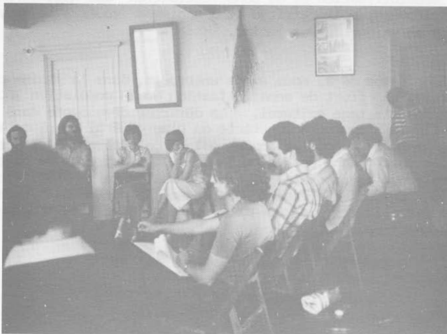
Vieux Presbytère Deschambault.