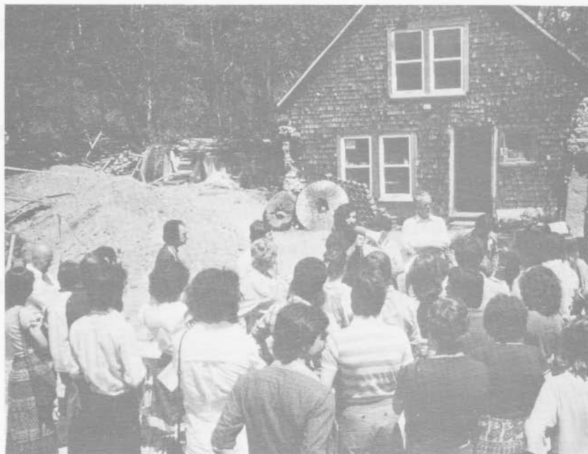
Moulin de la Chevrotière.