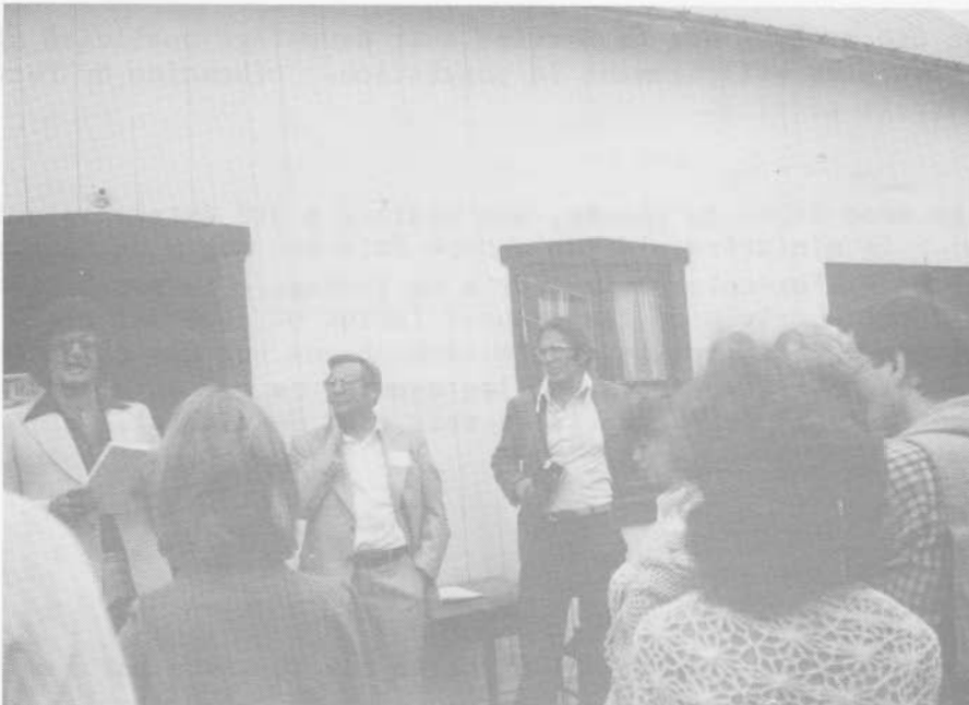
Domaine Seigneurial Beaumont.