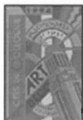
1994 Art Deco