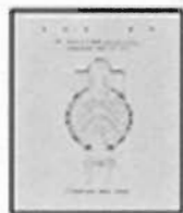
1993 Pub. Spaces