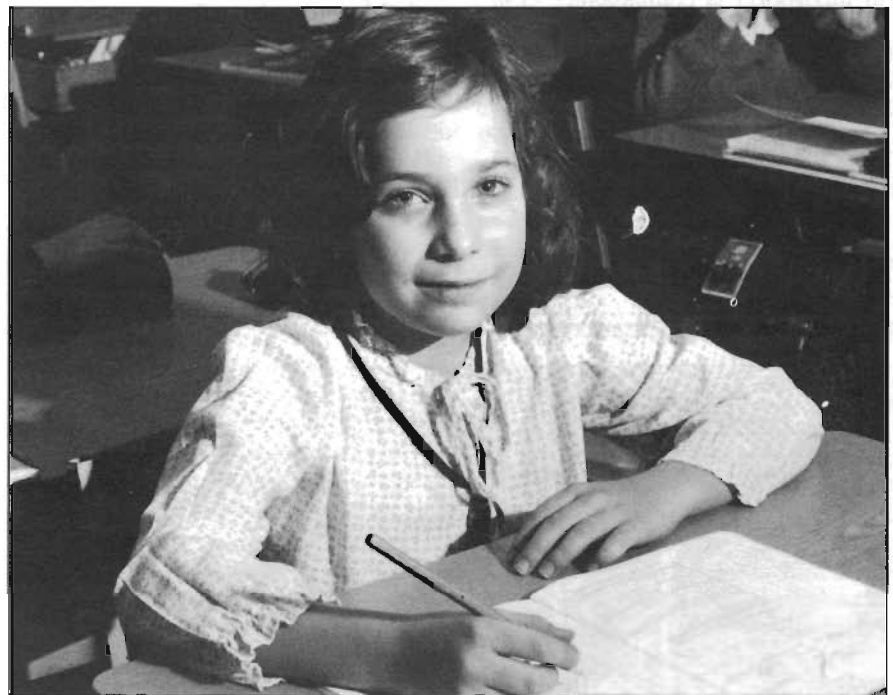
C'est par l'éducation que se fera la sauvegarde de notre patrimoine. It is through education that our heritage will be saved.

L'Assemblée générale d'ICOMOS Canada a adopté le thème de l'éducation et de la formation pour sa prochaine réunion annuelle. La communauté internationale des spécialistes d'ICOMOS, rassemblée à Washington, D.C. en 1987, a reconnu que c'est d'abord et avant tout par la formation et l'éducation que se fera (ou ne se fera pas) la sauvegarde de notre patrimoine. (suite p.2)