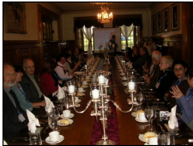
Dîner dans le mess des officiers

représentants des pays suivants : Australie, Norvège, Pologne, Hongrie, Île Maurice, États-Unis et Canada.