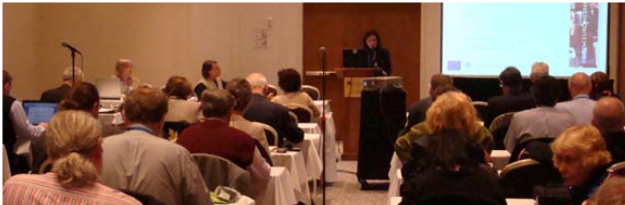
Les présidents des comités nationaux participant aux réunions du comité consultatif de l'ICOMOS présidé par John Hurd du Royaume-Uni

l'après-midi, les délégués se sont rassemblés en quatre sous-comités pour discuter 1) des membres et des statuts, 2) de la coopération régionale, 3) de la coopération entre les comités nationaux et les comités scientifiques internationaux et 4) de l'implication des comités nationaux dans le travail de l'ICOMOS pour la Convention du patrimoine mondial de l'UNESCO. Une des questions qui préoccupe beaucoup l'organisation est celle des cotisations annuelles. Les comités nationaux constatent qu'après avoir payé les cotisations à Paris, il ne leur reste presque plus de fonds pour gérer leur comité national. En revanche, les délégués demeurent tous très réservés sur des propositions nouvelles de financement qui impliqueraient soit la révision de la structure de l'organisation, soit de nouvelles méthodes de gestion.