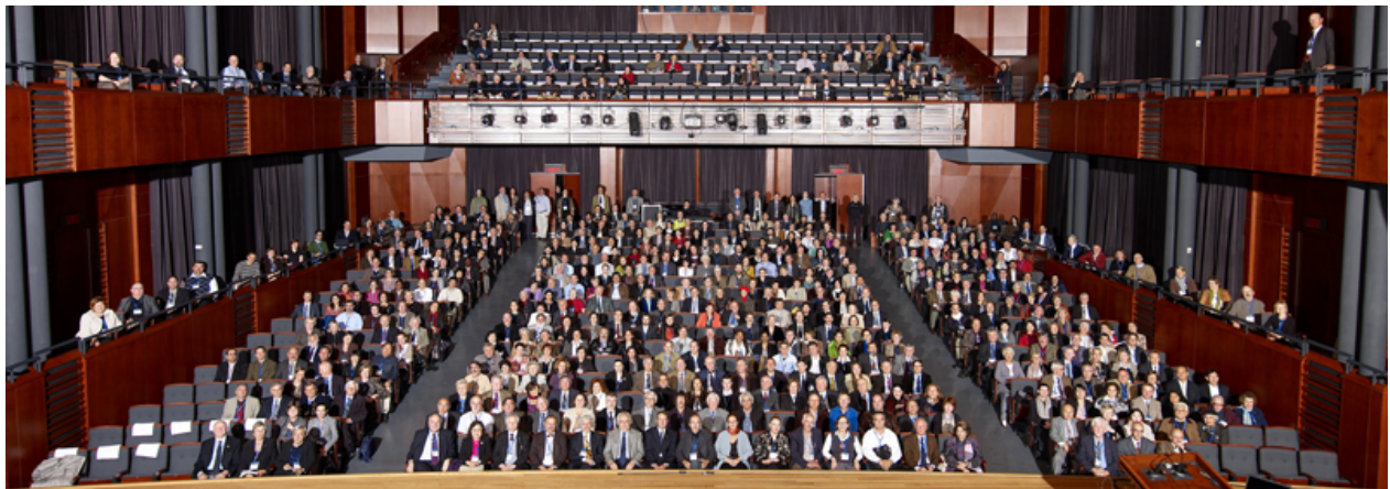
800 délégués venus de 70 pays ont participé à la 16 e Assemblée générale de l'ICOMOS à Québec. Photo: Palais Montcalm, Québec, 30 octobre 2008