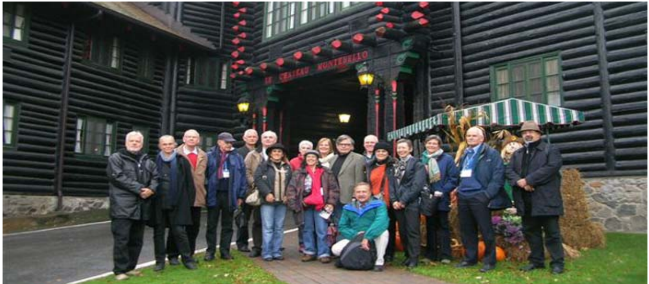
Participants en face de l'hôtel Montebello construit avec des billes d'arbres et située à mi-chemin entre Montréal et Ottawa

La partie B (7-9 octobre) s'est déroulée à Ottawa et à Montebello. Elle comprenait une riche diversité de présentations et d'échanges fort intéressants concernant la colline parlementaire, le bloc du centre, la bibliothèque du Parlement, le canal Rideau, site du patrimoine mondial, le manoir Papineau et le château Montebello. En plus de longues marches et de tours en bateau par de splendides journées d'automne, le programme comprenait de nombreuses occasions de discuter avec des professionnels responsables à chacun des sites au cours de repas mémorables et de réceptions dans des endroits spéciaux, y compris avec les membres d'ICOMOS Canada à Montréal et à Ottawa.