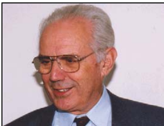
Prof. Raymond Lemaire

Le nouveau Fonds international Raymond Lemaire a été présenté lors du Forum des jeunes professionnels et chercheurs à Québec le 27 septembre 2008. Ce nouveau programme de l'ICOMOS a pour objectif la formation de jeunes professionnels : grâce à l'octroi de bourses d'études et à la conclusion d'accords de coopération avec des centres de formation, des jeunes professionnels du patrimoine pourront participer à des cours post-graduat ou des stages de formation dans le monde entier.