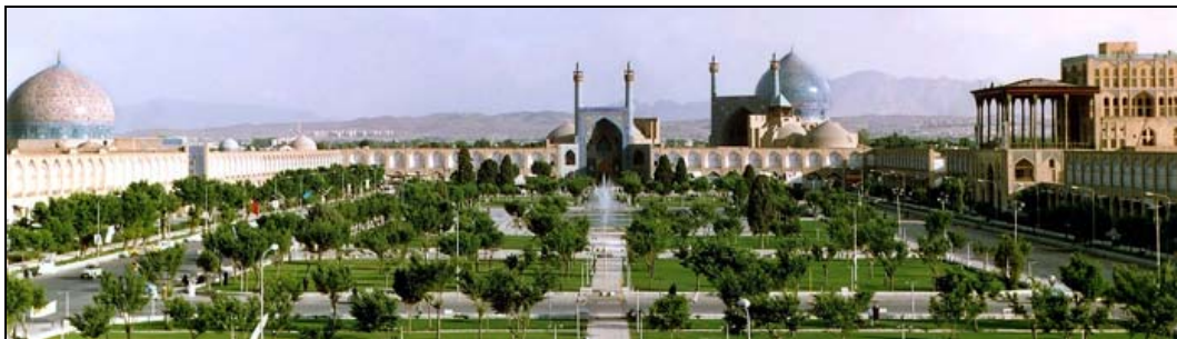
La place Naghshe Jahan, Isfahan, Iran