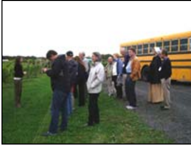
Délégués visitant l'Île d'Orléans