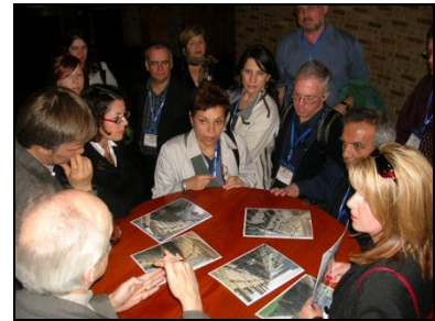
Discussions en groupes