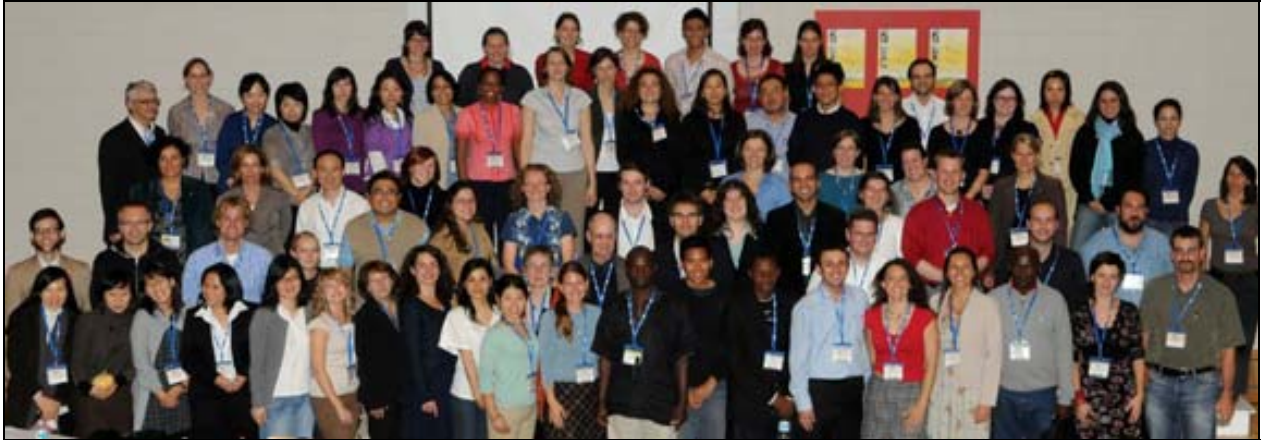
Les participants au forum des jeunes ont discuté de différents aspects du thème « l'esprit du lieu »