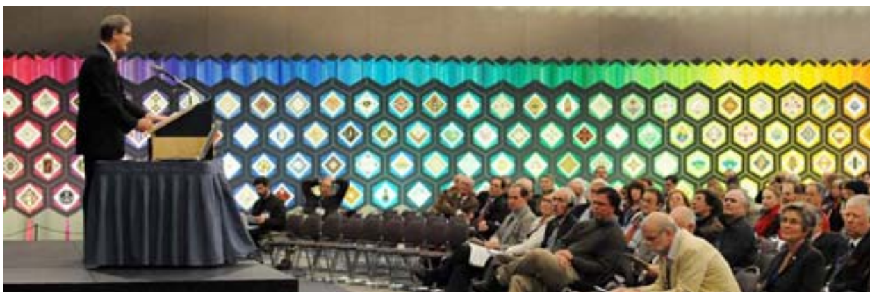
La tapisserie "Fibres du monde" est l'œuvre de l'artiste ontarienne Esther Bryan. Ce magnifique ouvrage a servi de toile de fond aux rencontres des participants tout en leur rappelant que nous avons tous une place dans le tissu social

La tapisserie « Fibres du monde » fut exposée au Centre des congrès et servit de toile de fond aux rencontres des participants au congrès d'ICOMOS. « Fibres du monde » est un projet d'art textile remarquable qui prouve que tous ont leur place dans le tissu social. « Fibres du monde » est une