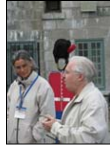
Denis St-Louis Arch.

Le comité international de la pierre fut accueilli par le comité pierre d'ICOMOS Canada. Il a tenu une réunion de travail et organisé plusieurs visites spécialisées pour favoriser l'échange entre les membres canadiens et étrangers.