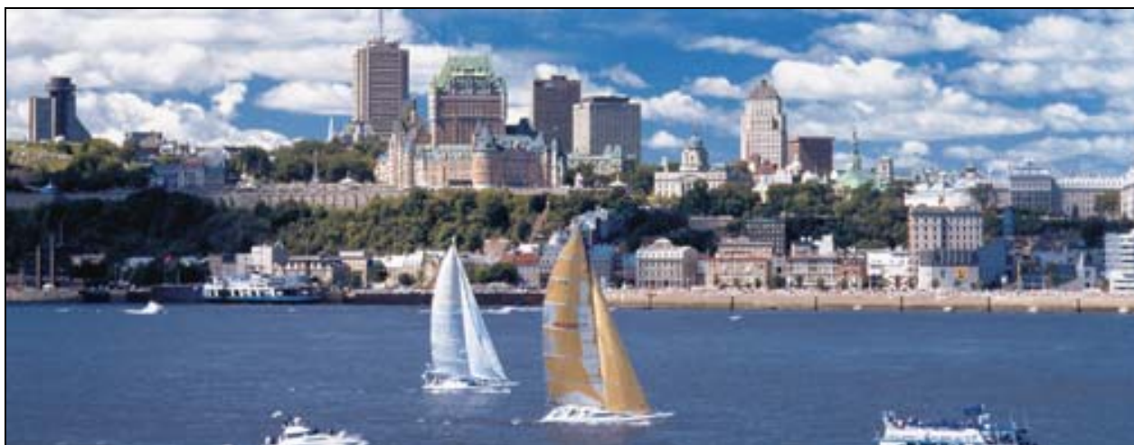
Vue panoramique de la ville de Québec

La Déclaration de Québec s'inscrit dans une série de mesures et d'actions entreprises par l'ICOMOS depuis 2003 pour sauvegarder et promouvoir l'esprit des lieux, principalement leur caractère vivant, social et spirituel. Les jeunes qui ont participé au Forum des jeunes chercheurs et professionnels en patrimoine ont contribué de façon significative à l'élaboration de cette Déclaration. Également, pour la première fois à l'ICOMOS, l'utilisation d'un Blog a permis à tous les membres de l'ICOMOS ayant accès à Internet de contribuer à l'amélioration du texte original élaboré par l'équipe du professeur Laurier Turgeon. On peut télécharger la Déclaration de Québec à partir du site Internet de l'ICOMOS ( http://www.icomos.org )