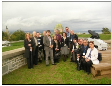
Les délégués IcoFort à la Citadelle