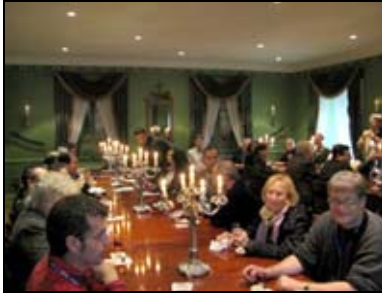
Réception à la Redoute Dauphine