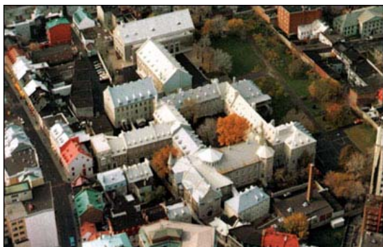
Le monastère des Ursulines à Québec, lieu de la rencontre du forum des jeunes

Les conclusions des réflexions ont été synthétisées et présentées par Célia Forget, coordonnatrice du comité scientifique, à tous les participants du symposium scientifique lors de la plénière du jeudi 2 octobre. Là encore, les résultats énoncés ont été accueillis chaleureusement. Sans tous les reprendre, les points les plus importants mis en lumière par les jeunes du forum concernaient : 1) l'implication des communautés locales dans la définition de l'esprit du lieu afin que la mémoire ne soit pas imposée uniquement du haut (instances politiques et universitaires) vers le bas (la population), 2) la mise en garde contre l'abus de mémoire qui peut dériver vers la surexploitation (folklorisation, voire même disneyfication) de l'esprit du lieu tout autant que l'abus de l'oubli qui peut amener à l'étiollement de l'esprit du lieu, 3) le décloisonnement disciplinaire afin que les jeunes chercheurs et professionnels développent une vision commune de ce qu'est l'esprit du lieu, 4) le fait de rendre le plus accessible possible la transmission du patrimoine de chacun.