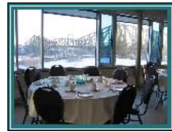
Restaurant La Grande Ourse

Vingt-cinq délégués ont participé à la réunion annuelle et aux élections d'ISCARSAH, le 29 septembre. On a présenté des rapports des divers groupes de travail, le nouveau site Internet d'ISCARSAH, les activités projetées pour la prochaine période triennale, les nouveautés concernant la préparation de l'annexe sur les structures patrimoniales pour la norme ISO13822. La réunion matinale fut suivie d'un déjeuner dans le Vieux-Québec dans le cadre de la participation aux activités d'IcoFort qui devaient avoir lieu en après-midi conjointement avec le comité international sur la pierre et celui sur les itinéraires culturels. Cette visite promettait d'être une expérience unique pour les visiteurs venus découvrir l'esprit du lieu relié à la construction des ouvrages défensifs et les défis de leur conservation dans le contexte du climat canadien.