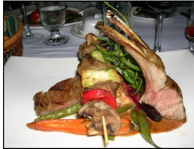
L'art culinaire de l'île d'Orléans