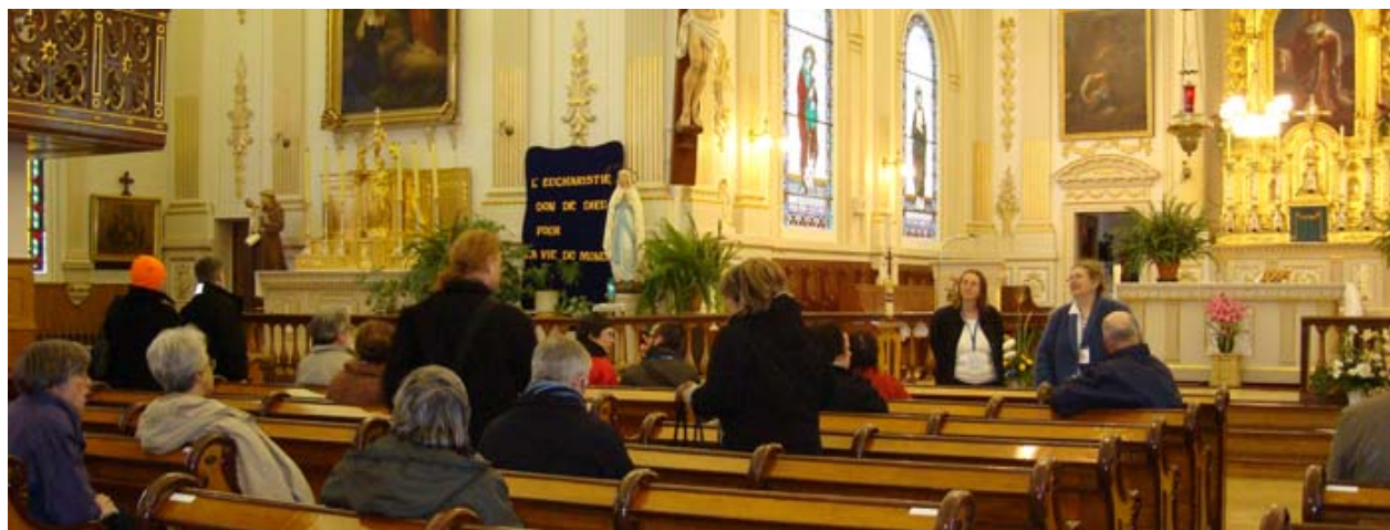
Délégués de l'ICOMOS visitant l'église de Saint-Antoine-de-Tilly près de Québec, en route vers le manoir Joly-de-Lotbinière

Sept circuits différents étaient disponibles : le Vieux-Québec et l'île d'Orléans, le chemin du Roy et le village de Deschambault-Grondines, le chemin Marie-Victorin et le domaine Joly-de-Lotbinière, le site huron wendake et certains sites archéologiques de la ville de Québec, un circuit muséologique avec des conservateurs et des restaurateurs, les fortifications, la Citadelle, les fort et château Saint-Louis ainsi que les Plaines d'Abraham, enfin, un circuit sur la Côte-de-Beaupré qui empruntait la route de la Nouvelle-France jusqu'au site de Cap-Tourmente. Plus de 600 personnes ont participé à ces visites.