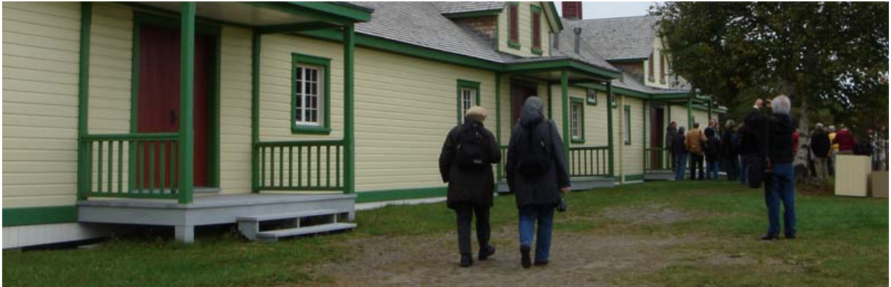
65 délégués ont participé à l'excursion en bateau au site historique national de Grosse-Île-et-le-mémorial-des-irlandais organisé par le CIAV. On voit les participants s'appêtant à visiter le Lazarium.

Le CIAV a organisé une excursion en bateau jusqu'au site historique national de Grosse-Île avec son mémorial des Irlandais. Soixante-cinq personnes de 19 pays ont participé à l'excursion. Durant la soirée, le comité a tenu son assemblée annuelle à l'Auberge du Quartier. Les sujets abordés ont permis d'élaborer deux résolutions qui ont été adoptées par l'AG d'ICOMOS (protection de l'architecture vernaculaire dans les régions affectées par les désastres naturels et la construction d'un pont à Tomo au Japon).