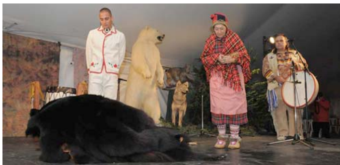
Des artistes autochtones locaux procédant au cérémonial de la chasse

Ce cérémonial de la chasse devait avoir lieu dans le magnifique décor historique du Manège militaire de Québec qui, malheureusement, a brûlé le 4 avril 2008. La solution de rechange fut d'organiser cet événement sous une tente montée sur les Plaines d'Abraham, près du jardin Jeanne-D'Arc. Une troupe locale a procédé au cérémonial de la chasse puis c'est le Sieur de Champlain lui-même qui est venu accueillir les invités et présenter les personnalités qui ont remis le prix Piero Gazzola et la médaille Jacques Dalibard.