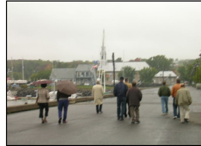
À la découverte du patrimoine local