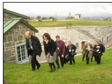
Les participants ont apprécié la visite technique des fortifications de Québec et de la Citadelle, dimanche 28 septembre

Plusieurs participants sont retournés à leurs hôtels après cette longue journée, mais la plupart, y compris les délégués du comité sur le patrimoine polaire, se sont retrouvés autour d'un buffet à la Redoute Dauphine pour profiter de l'occasion de parler avec leurs collègues des comités internationaux scientifiques dans un décor pénétré de l'esprit du lieu de cette ville fortifiée inscrite sur la Liste du patrimoine mondial.