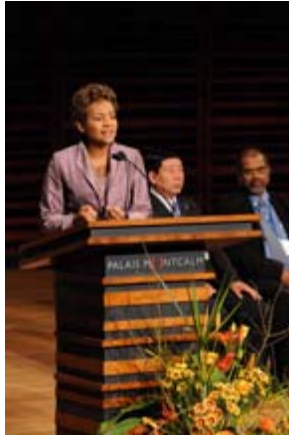
Son Excellence la très honorable Michaëlle Jean, Gouverneure générale du Canada.

Parlant des origines du Palais Montcalm, un édifice construit sur les fondations d'une ancienne halle, elle en a évoqué le patrimoine immatériel disparu pour mettre en évidence l'esprit de ce lieu (le bruit des chevaux, les cultivateurs criant à la volée le prix de leurs marchandises, la voix chaude et grave de Félix Leclerc, la grande Édith Piaf et le mythique B. B. King).