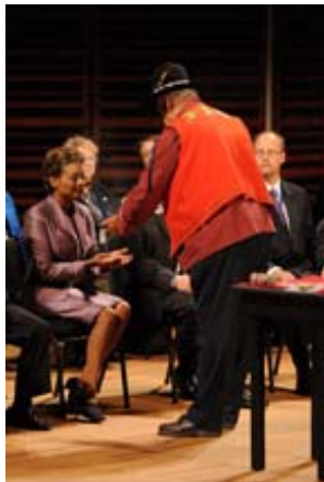
Max 'Oné-Onti' Gros-Louis, le Grand Chef de la nation huronne-wendat procédant à un cérémonial de purification. Photo B. Renaud

http://www.gg.ca/media/doc.asp?lang=f&DocID=5509