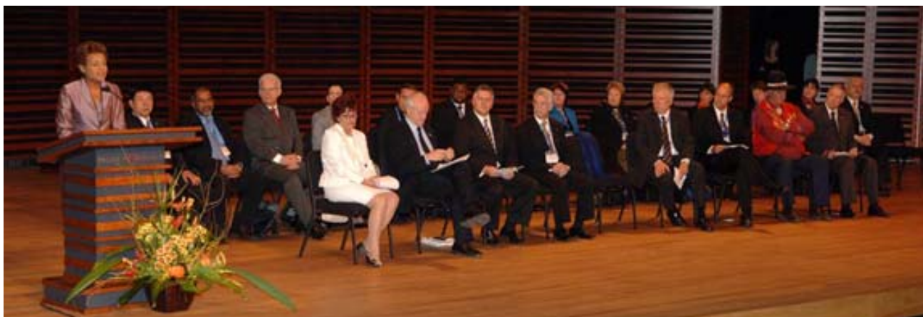
Son Excellence la très honorable Michaëlle Jean, Gouverneure générale du Canada s'adressant aux délégués de l'ICOMOS.

C'est au Palais Montcalm de Québec que Son Excellence la très honorable Michaëlle Jean, Gouverneure générale du Canada, a présidé les cérémonies d'ouverture à titre de présidente d'honneur de la 16e Assemblée générale et du Symposium scientifique international de l'ICOMOS. Elle y prononça un discours d'accueil remarquable et fort apprécié par les délégués venus de 70 pays et les dignitaires invités pour l'occasion.