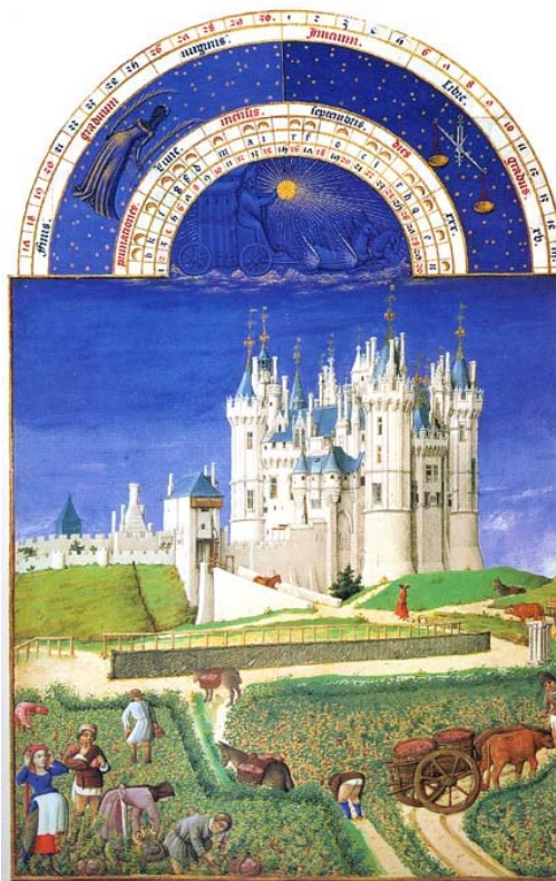
Les vendanges au pied du château de Saumur, propriété du duc de Berry, Riches Heures du duc de Berry, Musée du château de Chantilly