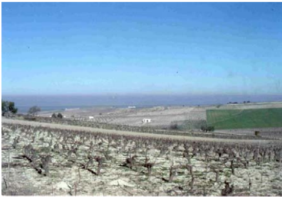
Ruedo de petites parcelles du vignoble de Xérès