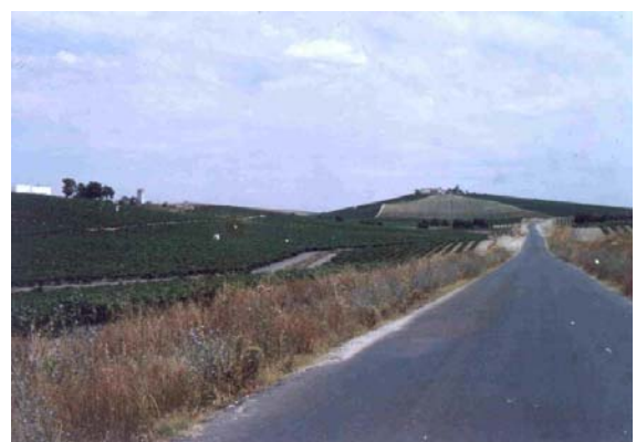
Route rectiligne sur les traces d'une voie romaine ; à gauche, bodega au milieu des vignes, Xérès