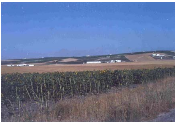
Les grands Pagos (« crus ») de Xérès, à l'ouest Jerez de la Frontera