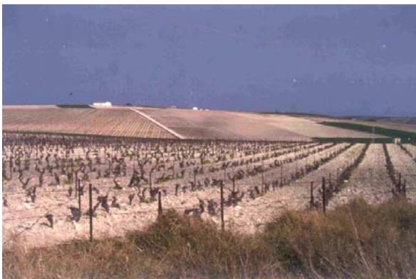
Grandes parcelles sur terres d'Albariza, Xérès