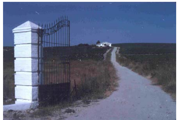
Accès à un grand domaine viticole, au sommet de la colline, une bodega