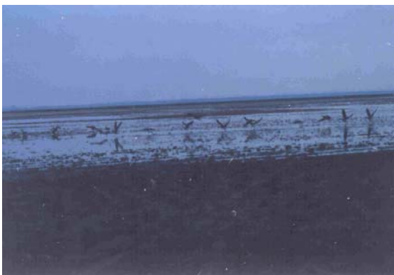
Marais du Guadalquivir, parc national de Doñana , proche du vignoble de Xérès