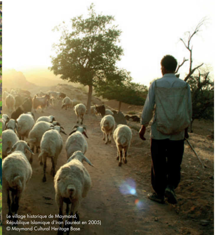
Le village historique de Maymand, République Islamique d'Iran (lauréat en 2005)