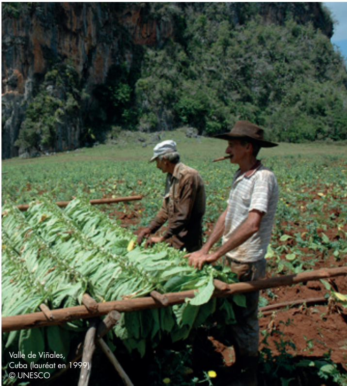
Valle de Viñales, Cuba (lauréat en 1999)