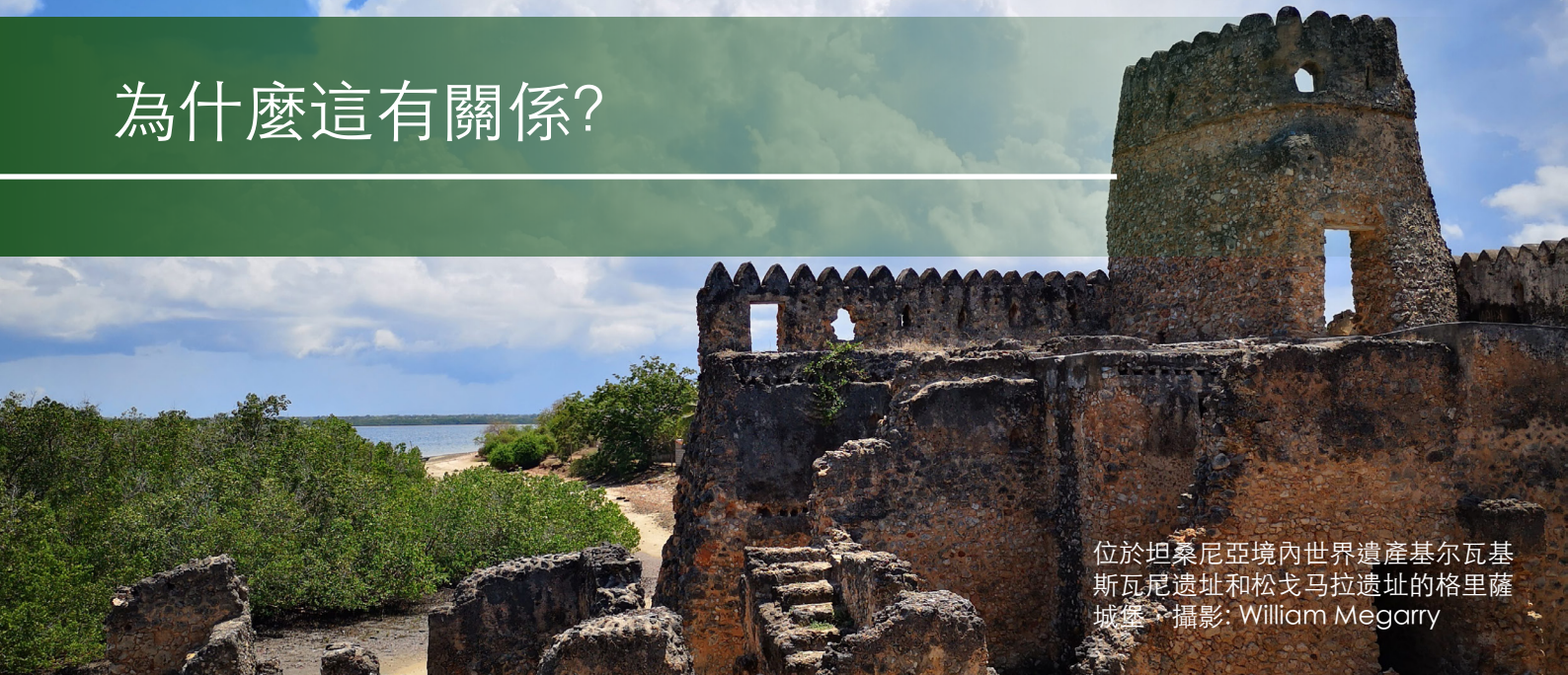
位於坦桑尼亞境內世界遺產基尔瓦基斯瓦尼遗址和松戈马拉遗址的格里薩城堡。