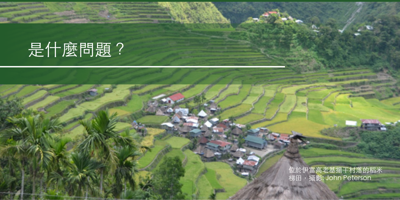
位於伊富高老基揚干村落的稻米梯田