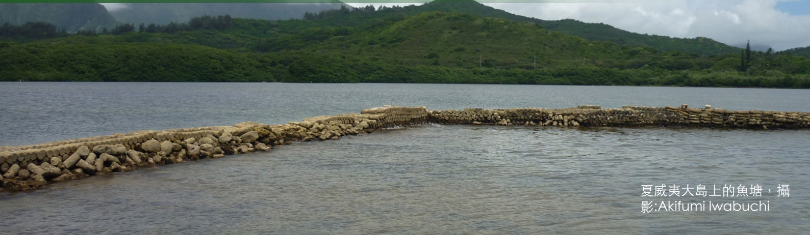
夏威夷大島上的魚塘