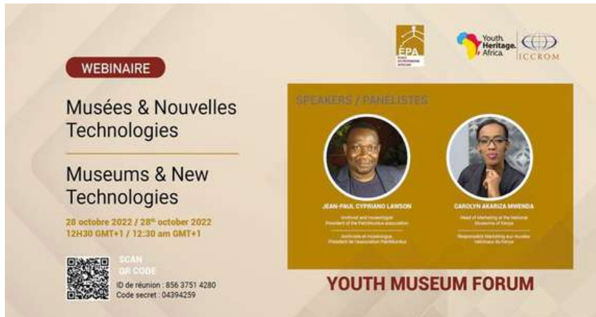
Webinaire Musées & Nouvelles Technologies