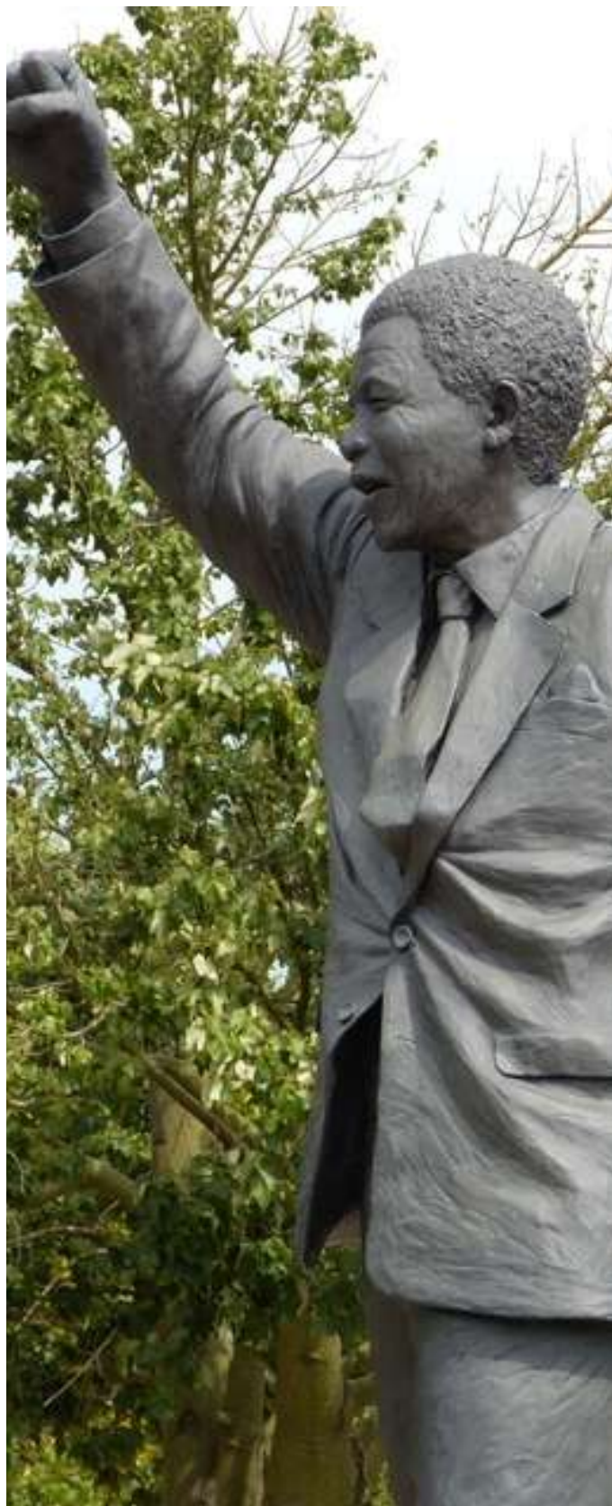
Nelson Mandela Pong Levé - Cape Town