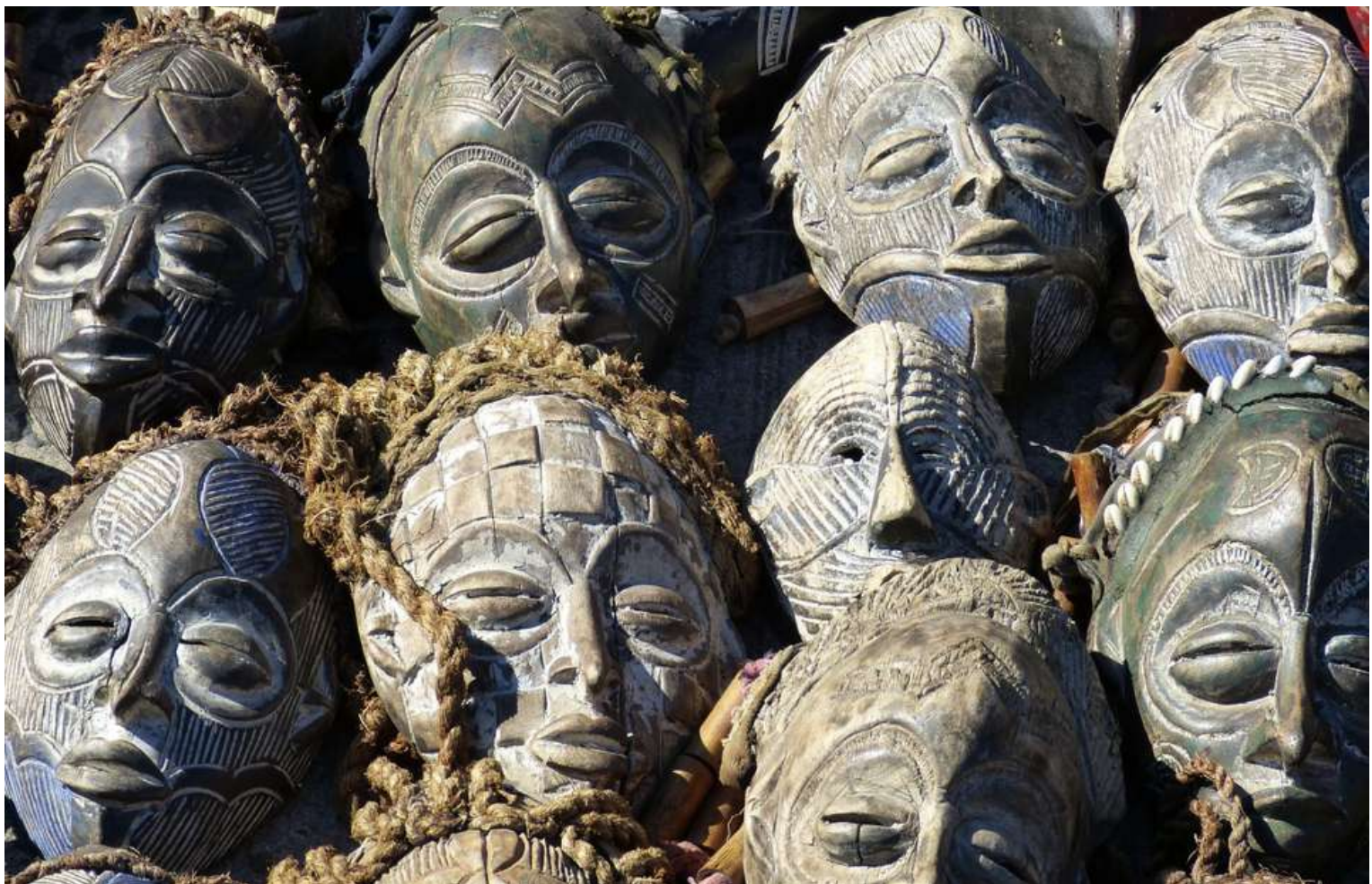
Série de masques sud-africain en bois