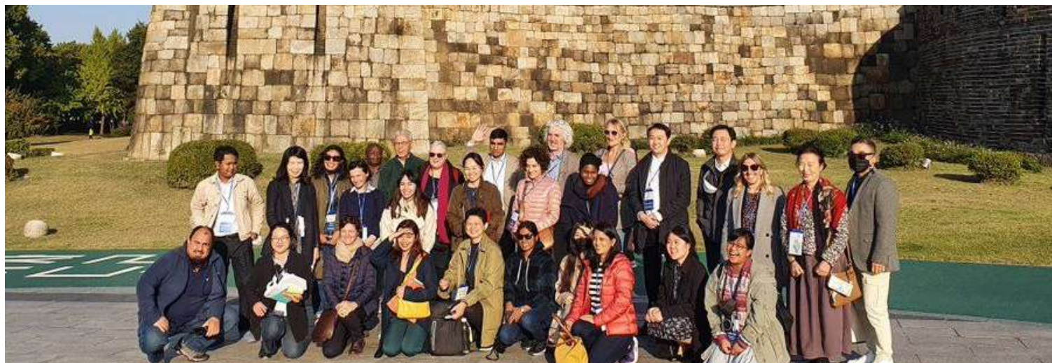
Photo de famille des participants au People Nature Culture Forum 2022

Du 10 au 12 octobre dernier, des professionnels du patrimoine, des universitaires et institutions du patrimoine ont été réunis à Suwon, en République de Corée, pour participer au Forum People-Nature-Culture 2022 (PNC Forum) sous le thème : « les bénéfices du patrimoine ». Conjointement organisé par le Centre international d'études pour la conservation et la restauration des biens culturels (ICCROM), l'Union internationale pour la Conservation de la nature (UICN), l'Administration du patrimoine culturel de Corée (CHA) et l'Université nationale coréenne du patrimoine culturel (KNUCH) ; le Forum PNC célébrait la conclusion du Fonds en dépôt Corée-ICCROM 2017-2022, l'achèvement imminent de la phase I du Programme de Leadership du patrimoine mondial (WHLP) et le 50e anniversaire de la Convention du patrimoine mondial.