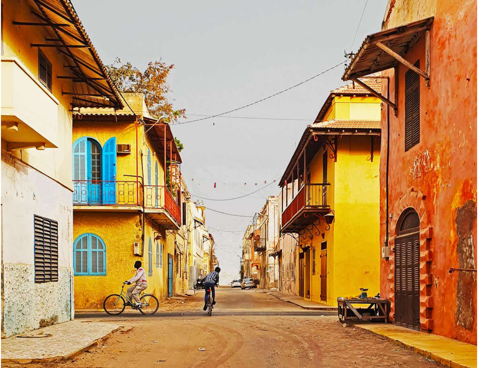
Vieille ville de Saint-Louis