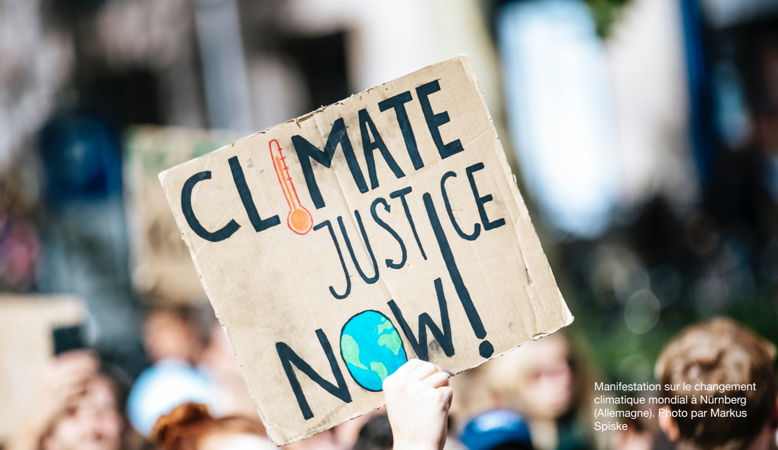
Manifestation sur le changement climatique mondial à Nuremberg (Allemagne).