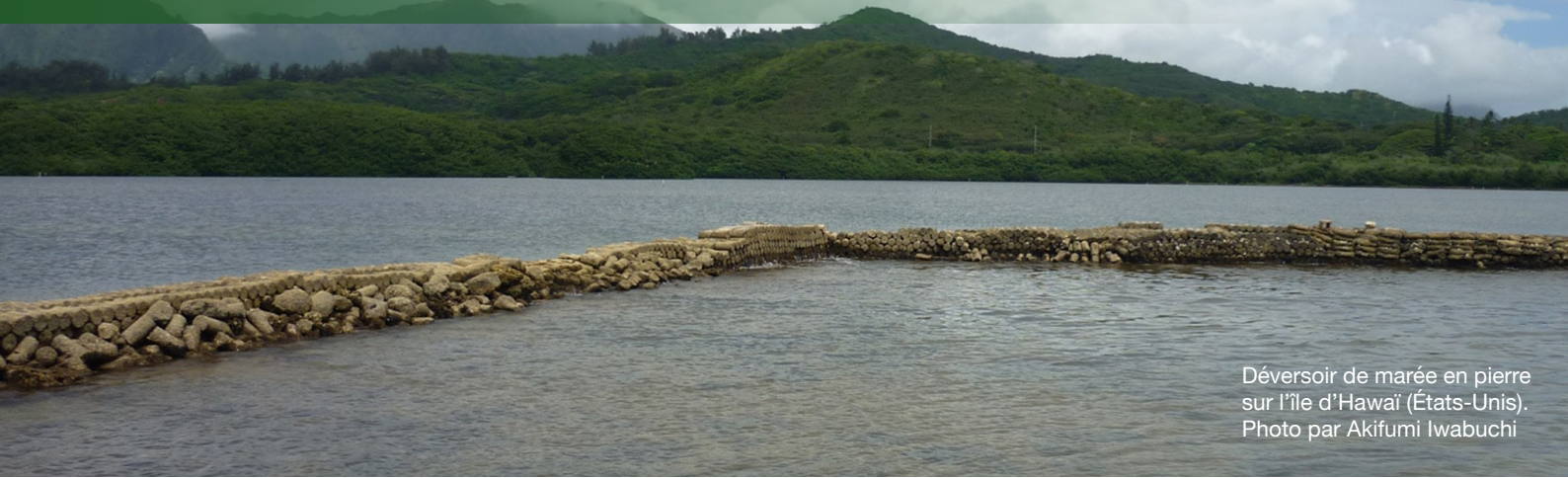
Déversoir de marée en pierre sur l'île d'Hawaï (États-Unis).

L' attention portée à la justice et à l'équité climatiques peut inclure des actions individuelles et collectives. Celles-ci peuvent inclure :