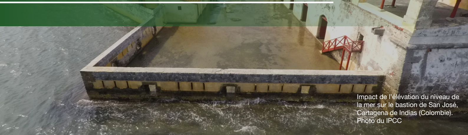
Impact de l'élévation du niveau de la mer sur le bastion de San José, Cartagena de Indias (Colombie).

L' ICOMOS doit adopter une approche inclusive et éthique de l'action climatique qui doit traiter les individus de manière juste ( justice ). Cela doit également être équitable, en partageant les fardeaux et les responsabilités, y compris les coûts et les bénéfices à travers la société ( équité ).