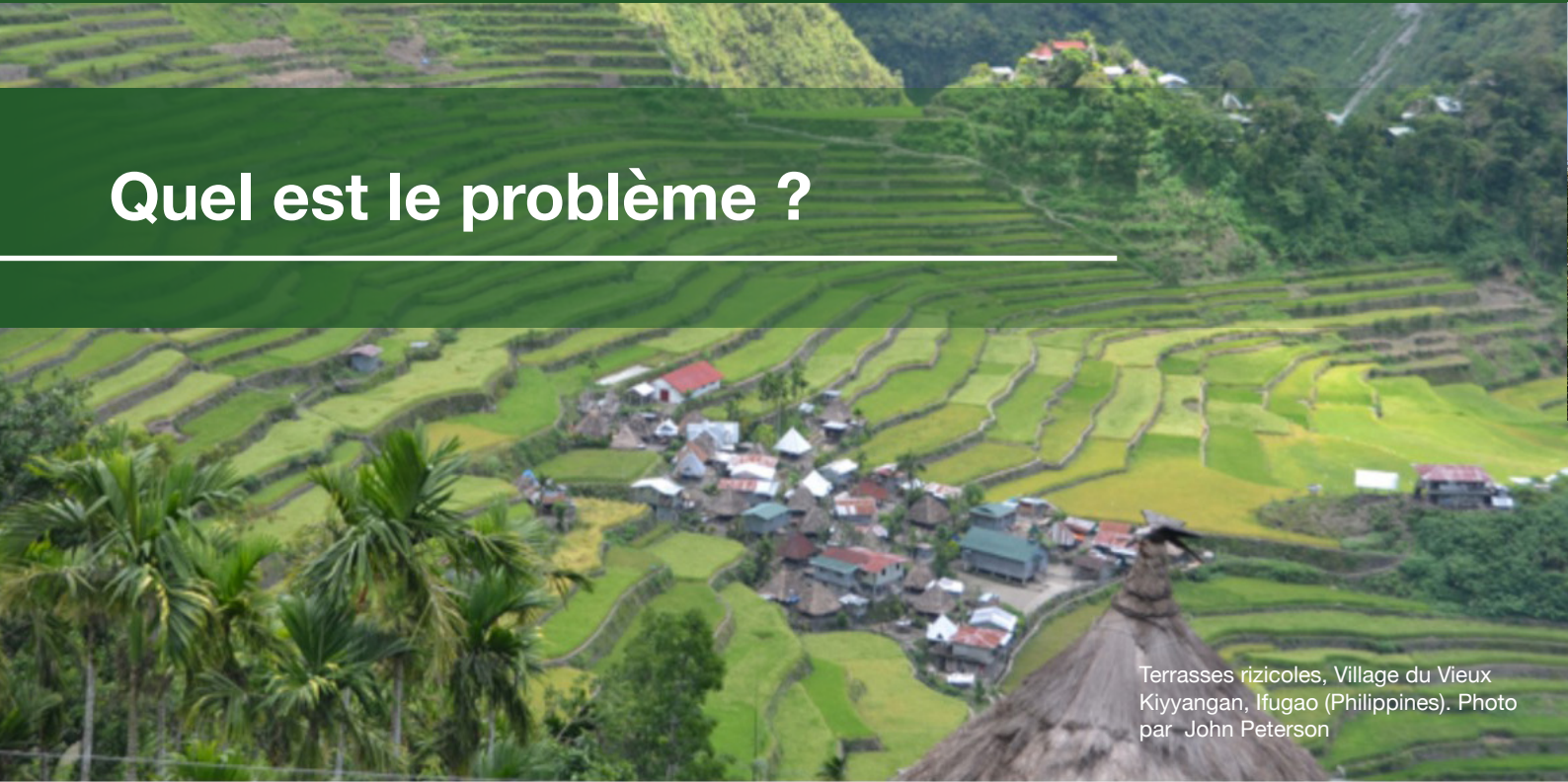
Terrasses rizicoles, Village du Vieux Kiyangan, Ifugao (Philippines).

L' objet de la justice climatique et de l'équité rassemble une série de thèmes relatifs aux droits humains et culturels. Plus précisément, il fait référence à la distribution injuste ou inéquitable des impacts et des réponses au changement climatique . Ceux-ci affectent généralement les personnes pauvres et vulnérables qui subissent un plus grand désavantage social et économique et une érosion et marginalisation de leurs droits humains et culturels individuels et collectifs. Ces expériences peuvent être exacerbées par l'oppression, la discrimination, le racisme, le sexisme, l'homophobie et la xénophobie. La promotion de l'équité implique de reconnaître comment ces inégalités fonctionnent dans la pratique et de s'efforcer d'y remédier. Elle exige que nous reconnaissons en particulier que :