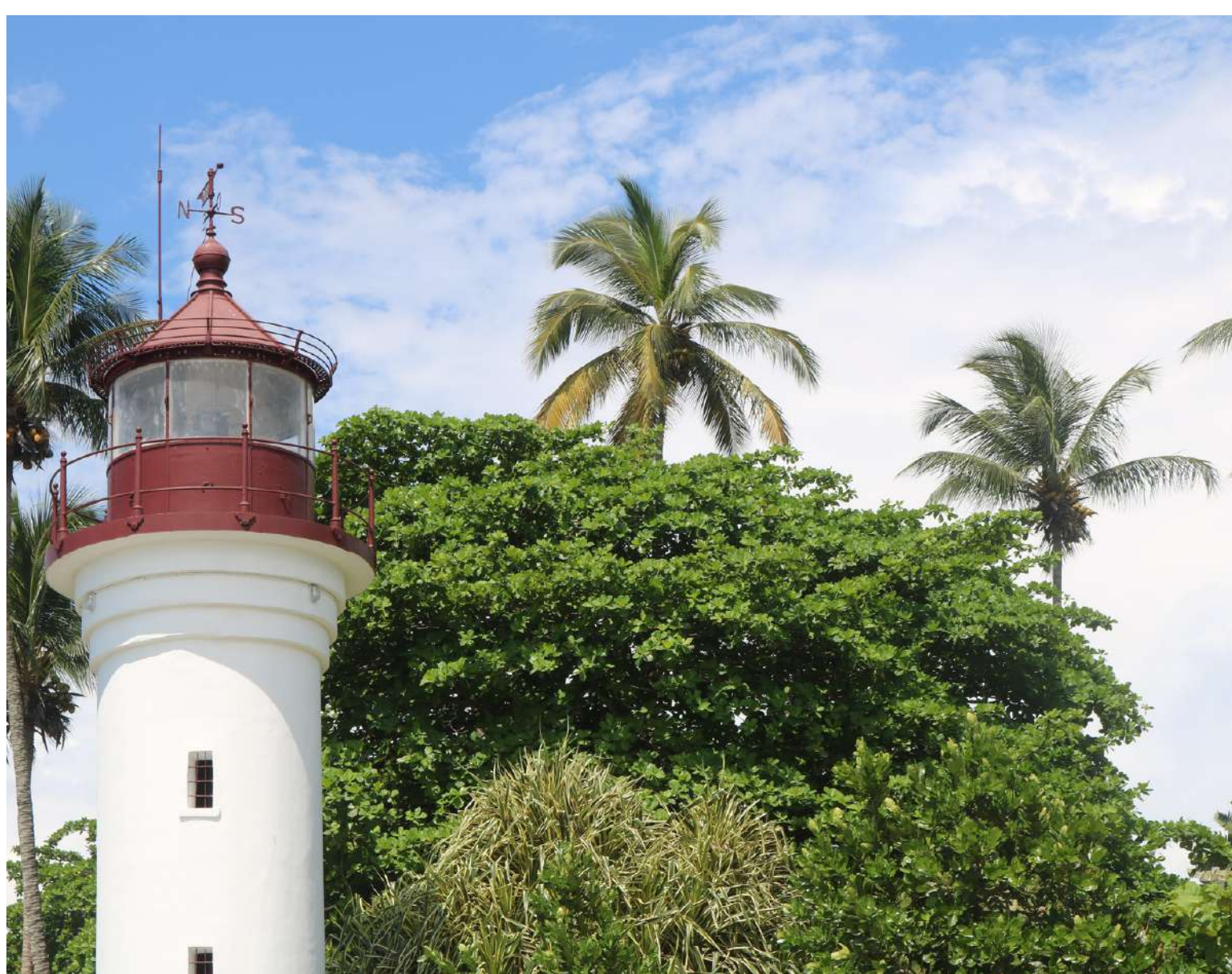
Le Phare à Kribi, Cameroun © Jean-Paul Lawson. 2021