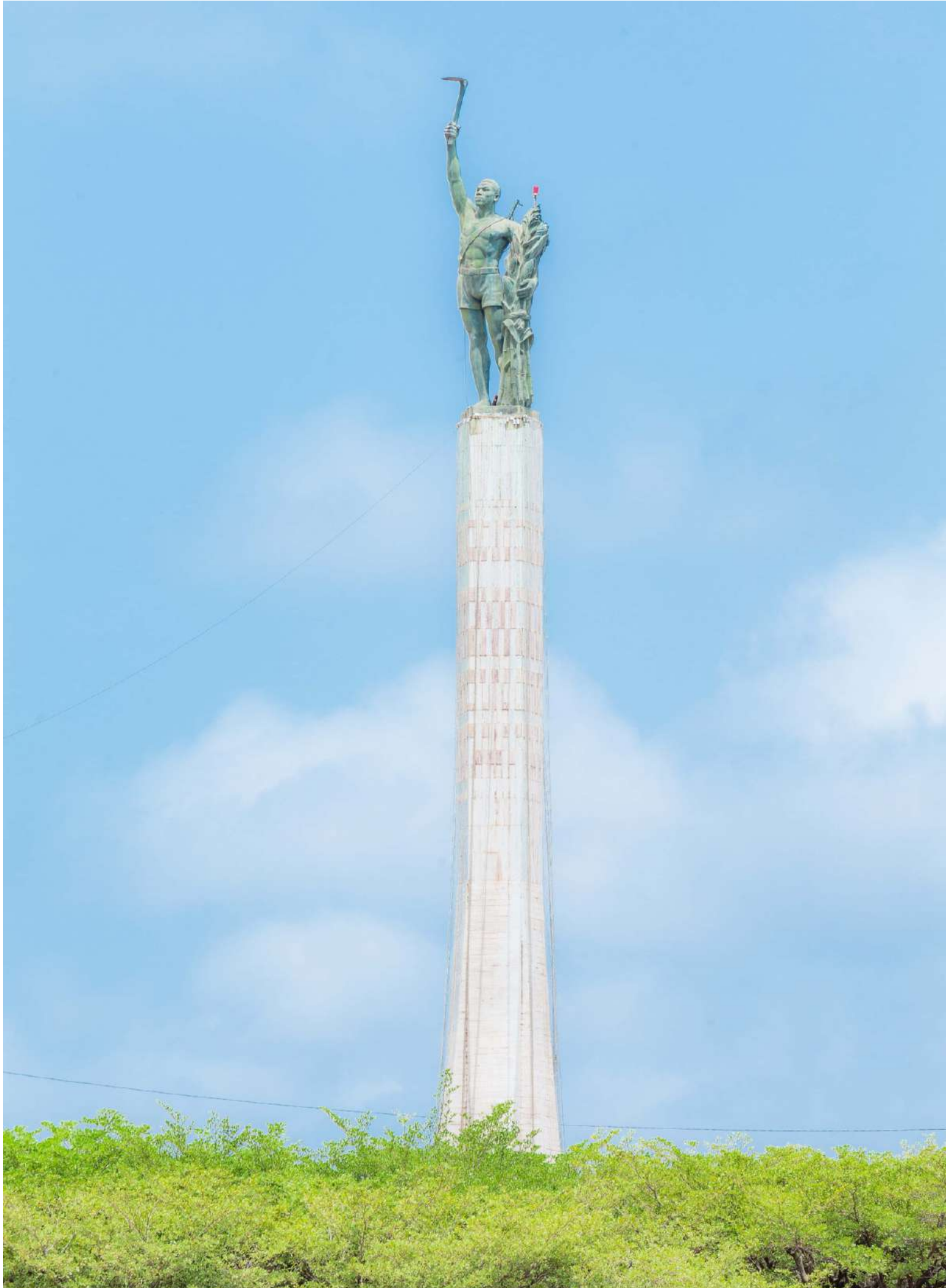
Monument de la place de l'Étoile Rouge, Cotonou, Bénin © Djidjoho Salomon. 2021