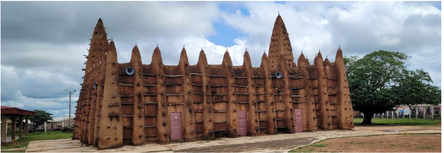
Grande Mosquée de Kong

Au début du XXème siècle, le Nord de la Côte d'Ivoire comptait près de 300 mosquées de style soudanais. Il n'en reste que 21 aujourd'hui. Parmi elles, les huit mosquées les mieux conservées et les plus représentatives du style soudanais ivoirien ont été inscrites sur la Liste du patrimoine mondial de l'UNESCO selon les critères (ii) et (iv). Elles sont situées dans les localités de Tengréla, Kouto, Sorobango, Samatiguila, Nambira, Kong et Kaouara.