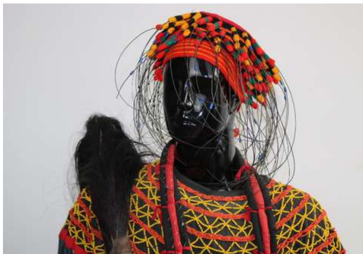
Costumes NDOP disponibles au Musée National du Cameroun

Etoffe patrimoniale la plus emblématique de l'aire culturelle grassfields au Cameroun, le Ndop (dont le nom varie selon les communautés) est une étoffe traditionnelle et rituelle, qui dans sa forme originale est un assemblage de bandes de coton et de fibres de raphia cousues bord à bord. Le traitement graphique et l'iconographie obéit à des codes. La richesse de cette étoffe réside d'emblée sur son identité visuelle, le blanc et le bleu indigo, mais surtout sur la combinaison de ses motifs et figures géométriques qui lui confèrent une valeur symbolique particulière. Sa conception suit un itinéraire particulier qui rentre dans ce qui est appelé « la route du NDOP » : le tissage du coton est fait au Nord Cameroun et le traçage des motifs et la teinture est faite à l'Ouest du pays. A l'origine, arborer le Ndop n'est pas un acte anodin. Tenue d'apparat, il est en partie ou en entier associé à la confection des tenues des rois, notables et membres des sociétés secrètes. Il est associé au symbolisme du pouvoir traditionnel, aux coutumes funéraires et rituelles. Objets décoratifs, il est utilisé pour la décoration des loges royales lors de grandes parades festives. Les motifs et figures géométriques figurant sur les tissus Ndop sont très représentatifs du rapport de l'homme avec la nature et l'au-delà. D'autres motifs géométriques se rapportent à des scarifications, des ornements d'architecture et de mobiliers.