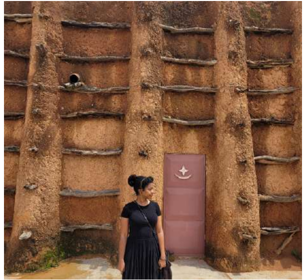
Affoh Gueneguez (Côte d'Ivoire) / Kong Mosques, Costa do Marfim. 2022