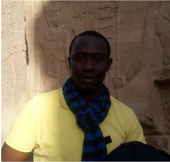
Jean-Paul Lawson (Benim) / Templo de Karnak em Luxor, Egipto. 2017