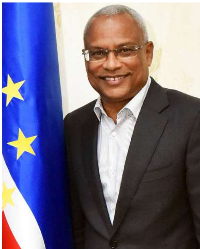
S. EXA. JOSÉ MARIA NEVES PRESIDENTE DE CABO VERDE