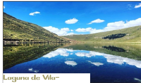
Laguna de Vila-Vila

Producto del pasar de tanto tiempo, tenemos hasta el día de hoy artesanos textiles perdidos en la noche de los tiempos. Estos artesanos cierran el círculo de la crianza de la alpaca criandola, esquilandola, tiñendo la fibra de manera natural con el uso de diversas plantas, y finalmente confeccionando hermosas prendas impregnando su cosmovisión ancestral.