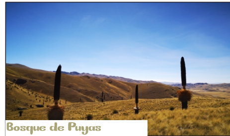
Bosque de Puyas de Raimondi

En esta laguna que a veces parece un espejo, encontramos un sin numero de aves entre migratorias y estacionarias. Dentro de ellas destaca la Huayata o Ganso Andino que anda siempre en parejas cuidando a sus pichones en tiempo de verano. Se hacen notar también los patos cordilleranos que alegres se sumergen para encontrar comida.