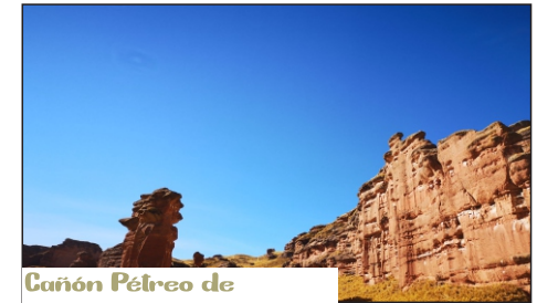
Cañon Pétreo de Tinjani

Las definimos como dinosaurios vegetales ya que florecen cada 100 años para difuminar sus semillas y luego morir. En su etapa de inflorescencia puede alcanzar hasta los 13 metros de altura y producir hasta 8 mil pequeñas flores y hasta 6 millones de semillas que son luego transportadas por las diferentes aves para reiniciar el ciclo. Su nombre en quechua es "Titanca" que significa "flor de flores".